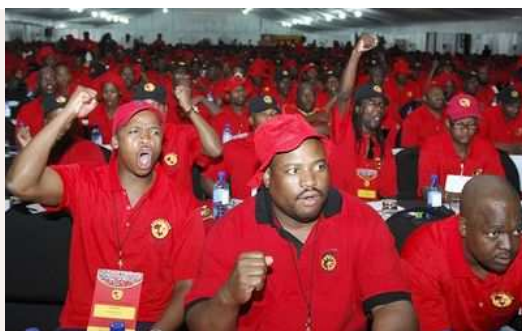
Congrès du NUMSA

A l'approche des élections générales au mois de mai et sur fond de mobilisation des mineurs, la question de la rupture des organisations d'origine ouvrière (SACP et COSATU) avec l'ANC - organisation bourgeoise - pour la défense des revendications ouvrières, est posée au sein des syndicats ouvriers. La grève des mineurs du platine montre que les dirigeants des mines refusent d'augmenter les salaires. La seule façon d'augmenter les salaires des mineurs c'est que l'Etat prenne le contrôle des mines, exproprie les capitalistes anglais et américains. Pour cela, les travailleurs doivent porter un véritable gouvernement ouvrier qui développerait ce programme. La réorganisation du mouvement ouvrier sud-africain doit être axée sur un programme socialiste.