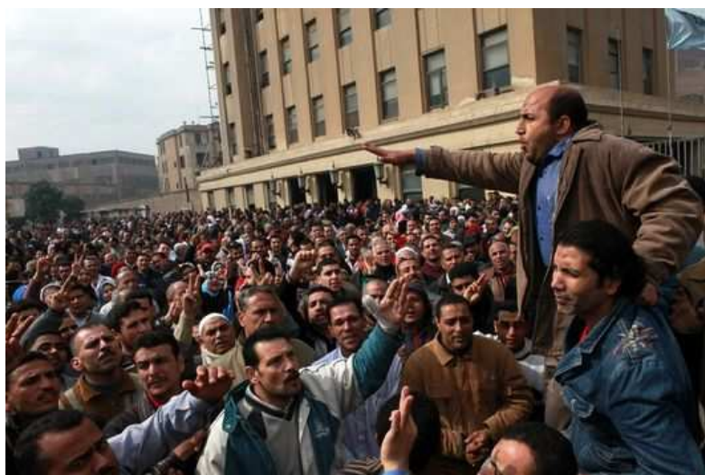
Grève des travailleurs de l'usine textile de Mahalla pour un salaire minimum – fév 2014

Pour cela, les travailleurs égyptiens ont besoin de construire un Parti ouvrier révolutionnaire.