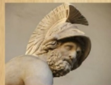
Ménélas roi de Sparte