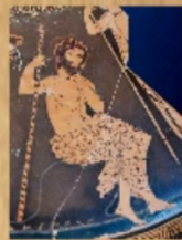
Agamemnon roi de Mycènes