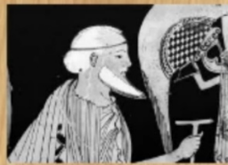
Priam roi de Troie