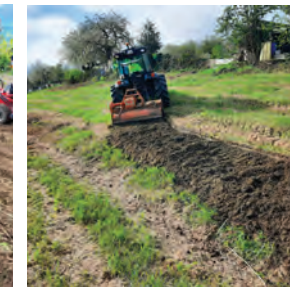
Section Bel Air