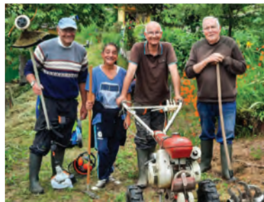
Section Quartier Gaillard