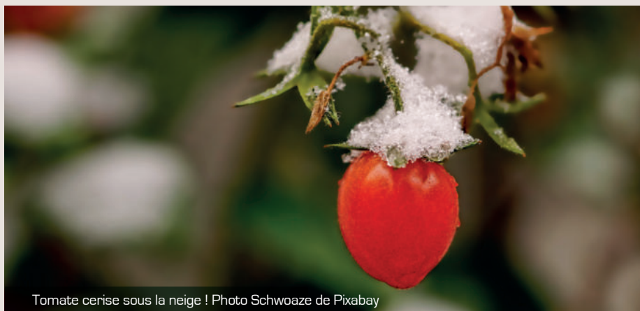
Tomate cerise sous la neige !