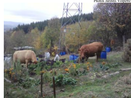
Dégustation de bons légumes par la race bovine.

2ème Serge Troubetzky Bel'air 2 Jardin N° 62