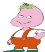
Amar Ouadi section Engrenage