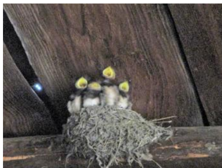
Nidification d'hirondelles dans une cabane de jardin.

2ème Serge Troubetzky Bel'air 2 Jardin N° 62