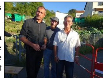
Les entreprises et le responsable de la section