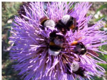
Bourdons en activité sur une fleur d'artichaut.