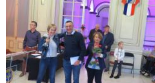
section Chana les Champs