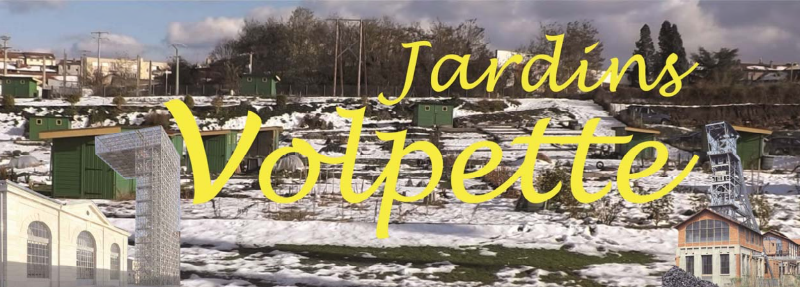
Photo Jardins Volpette