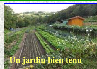
Un jardin bien tenu