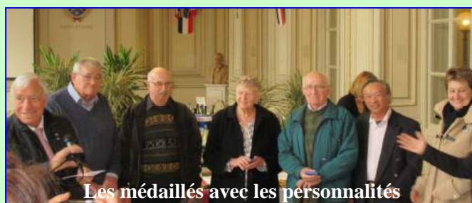
Les médaillés avec les personnalités