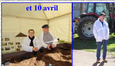
et 10 avril

Merci à tous les bénévoles qui ont tenus le stand des Jardins Volpette à la fête des plantes.