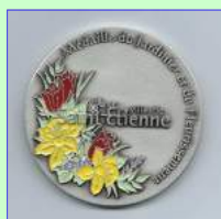
Médaille du jardinier