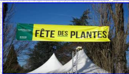
FÊTE DES PLANTES