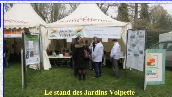
Le stand des Jardins Volpette