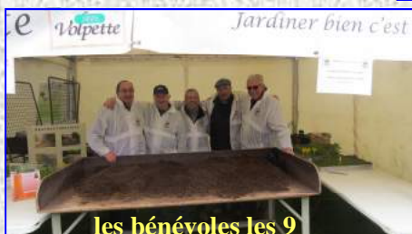
les bénévoles les 9