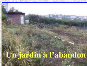
Un jardin à l'abandon