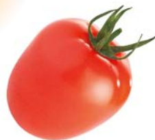
Allongée Le reine de l'été