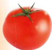
Ronde À cuisiner

Plaisirs et fraîcheur garantis pour toutes vos envies !