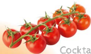
Cocktail À croquer