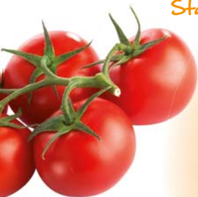
Grappe Savoureuse en salade