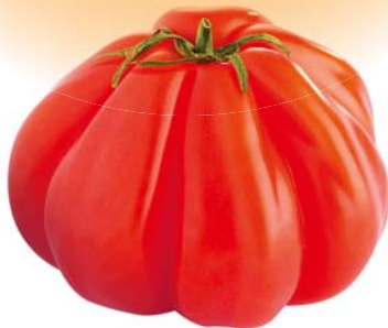
Cœur de bœuf Excellente cuite ou crue en salade