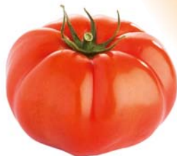
Cotelée Idéale à farcir