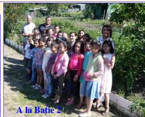
A la Batie 2