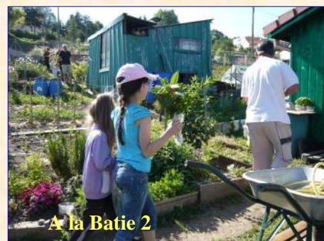
A la Batie 2