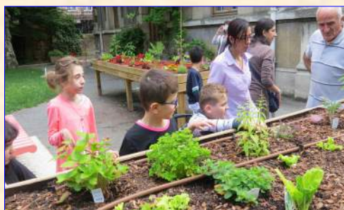
A la Charité

Les enfants des classes de CP, CE1 et CE2 de l'École élémentaire de Monthieu ont visité la section de Montplaisir et ceux de la CLIS ont visité les jardins de La Charité adaptés aux fauteuils roulants. Ceux des classes de CE1 et CE2 de l'école Vivaldi de Montreynaud se sont rendus à la section Batie 2 .