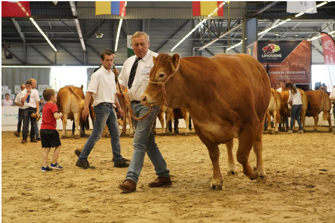
© SANA – Salon de l'Agriculture de Nouvelle Aquitaine, Aquitanima, 2019

la valeur des choses. L'échelle du temps a modifié le rapport avec ses manifestations. Au début du siècle, il y avait un champ de foire dans chaque petit village, cela veut dire qu'il y avait une foire dans chaque village, certes pas toutes les semaines, des fois une fois par mois, trois fois par an. Le monde agricole du XIX ème siècle a vécu à ce rythme-là. Je ne suis pas historien, mais quand j'étais à la fédération des marchés aux bestiaux, on le voyait bien : pourquoi y avait-il des marchés aux bestiaux à tel endroit et pas à tel autre ? La plupart des marchés qui ont continué à exister appartenaient à des très vieilles traditions, parfois de plus de 1000 ans.