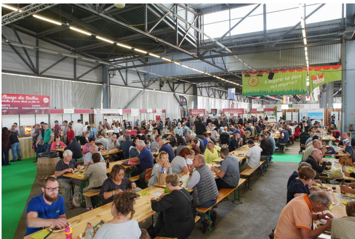
© SANA - Salon de l'Agriculture Nouvelle-Aquitaine, marché des producteurs, 2019

Oui, mais par rapport à nos contradicteurs, nous ne sommes pas rassurants. Nos contradicteurs disent que ce que nous faisons n'est pas bien et qu'il faut faire autrement, souvent de manière péremptoire. Nous disons que ce n'est ni blanc ni noir, ce sont toujours des balances, avantages et inconvénients de tel ou tel choix. Ou alors il faut revenir à la chasse et à la pêche, c'est possible, mais tout le monde ne pourra pas manger.