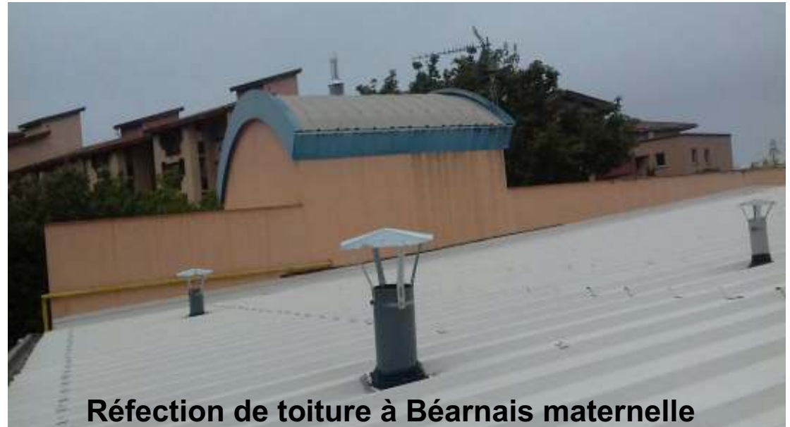
Réfection de toiture à Béarnais maternelle