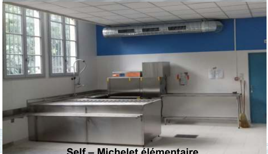
Self – Michelet élémentaire