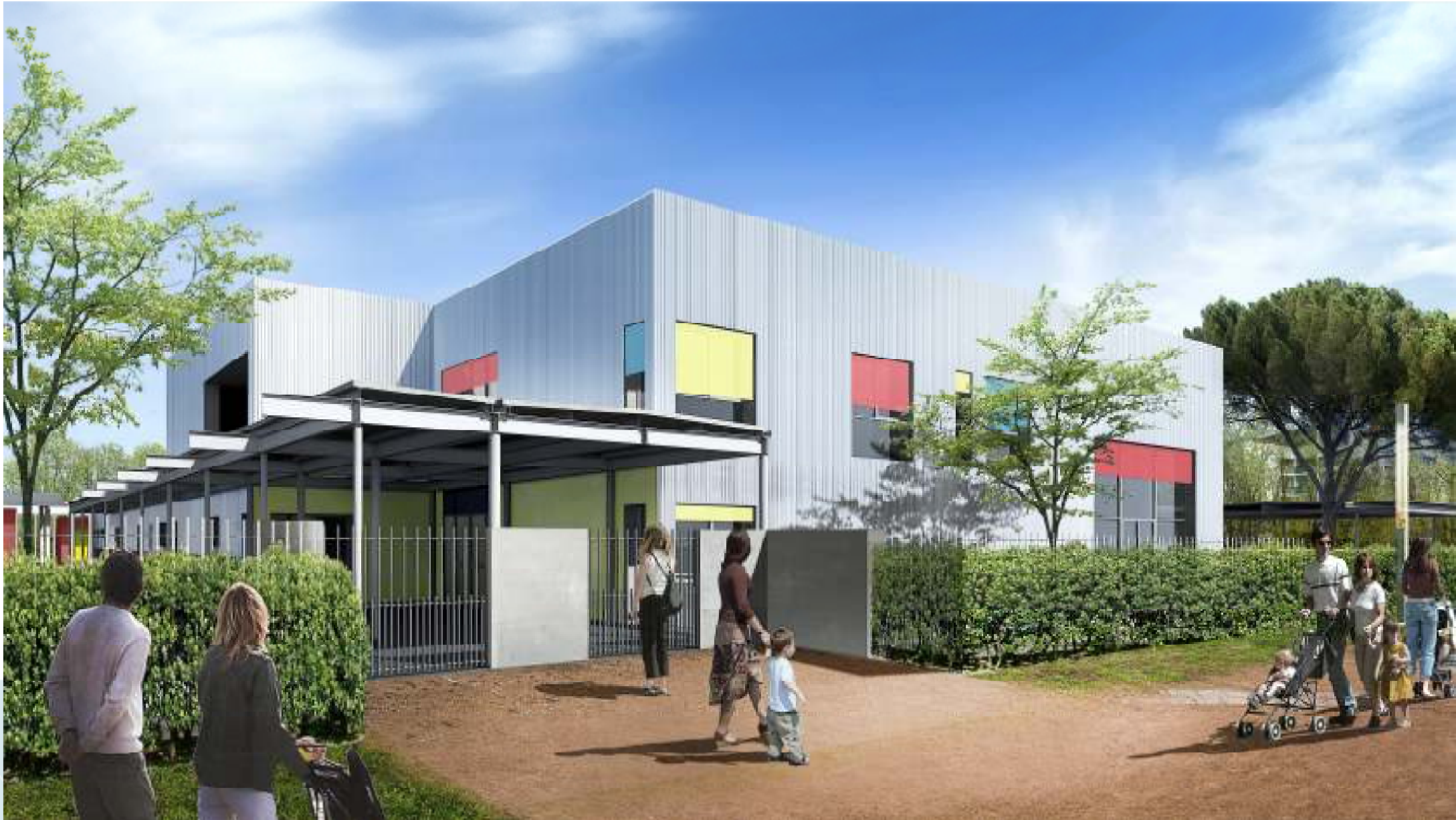
Future école Borderouge maternelle