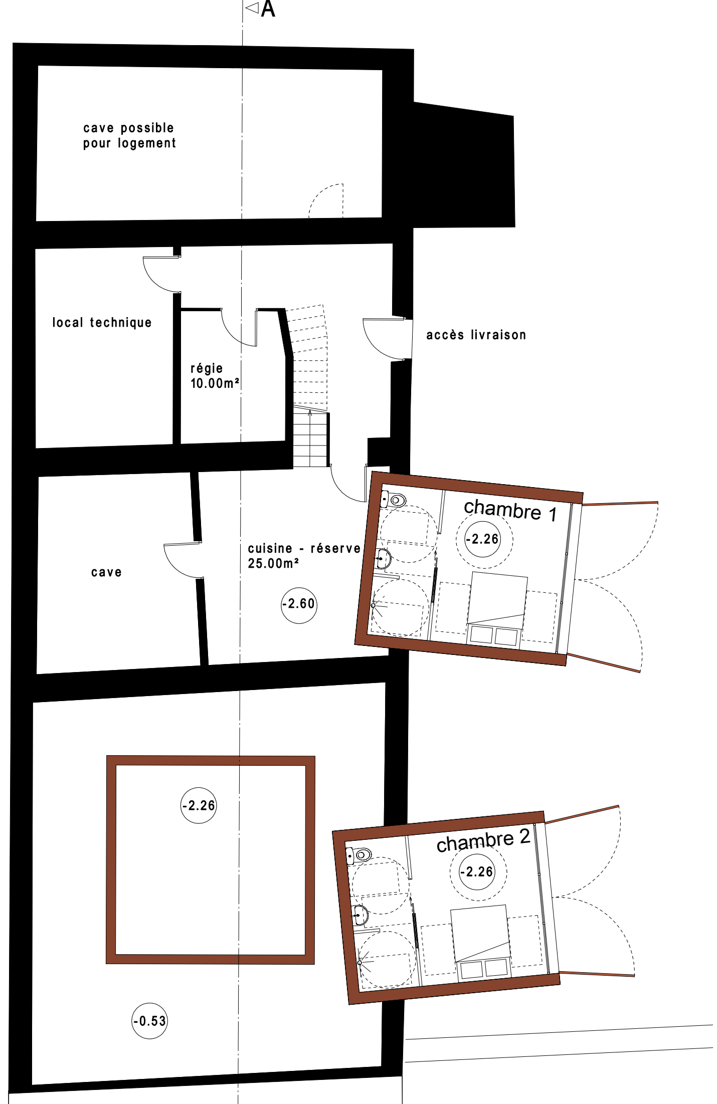
Plan du niveau caves 1/100e