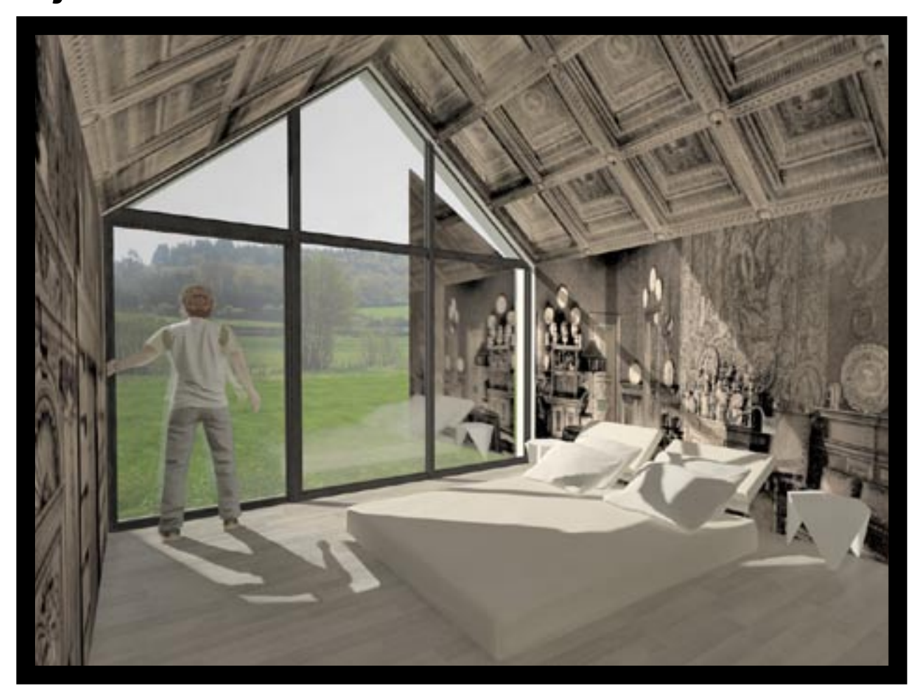
chambre «Intérieur Bourgeois»