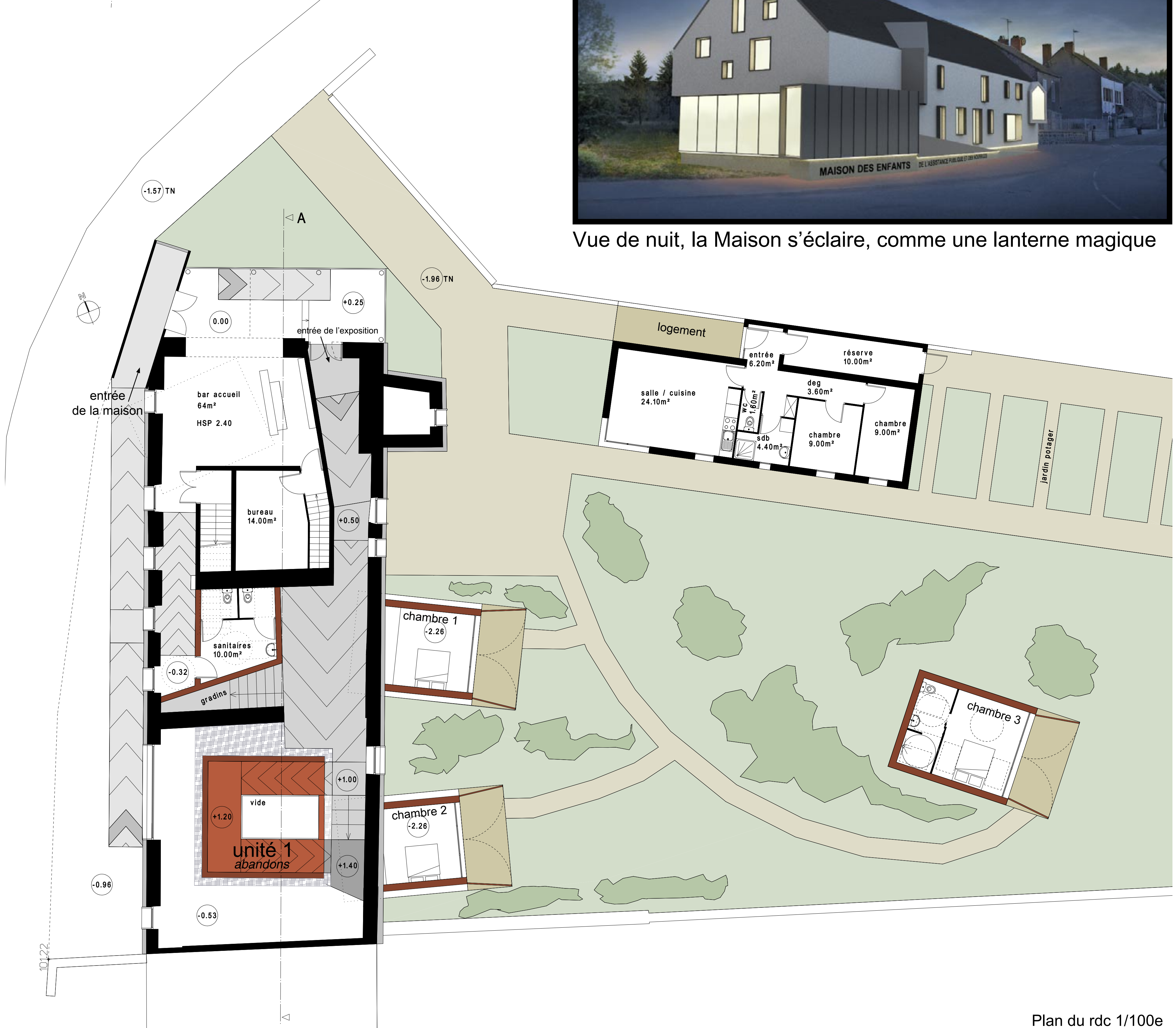
Plan du rdc 1/100e

Les chambres d'hôtes: reprenant le volume de la « maison », elles ouvrent sur le jardin