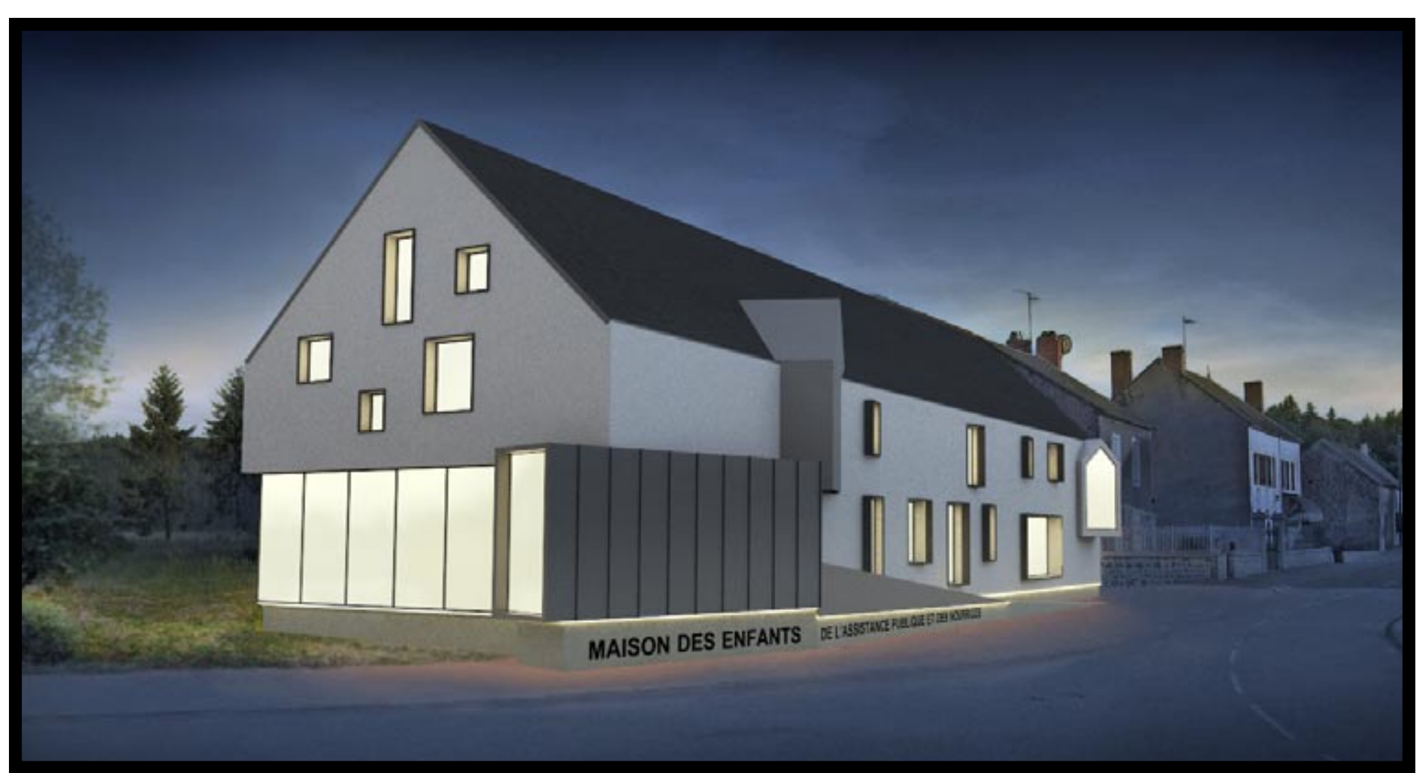
Vue de nuit, la Maison s'éclaire, comme une lanterne magique