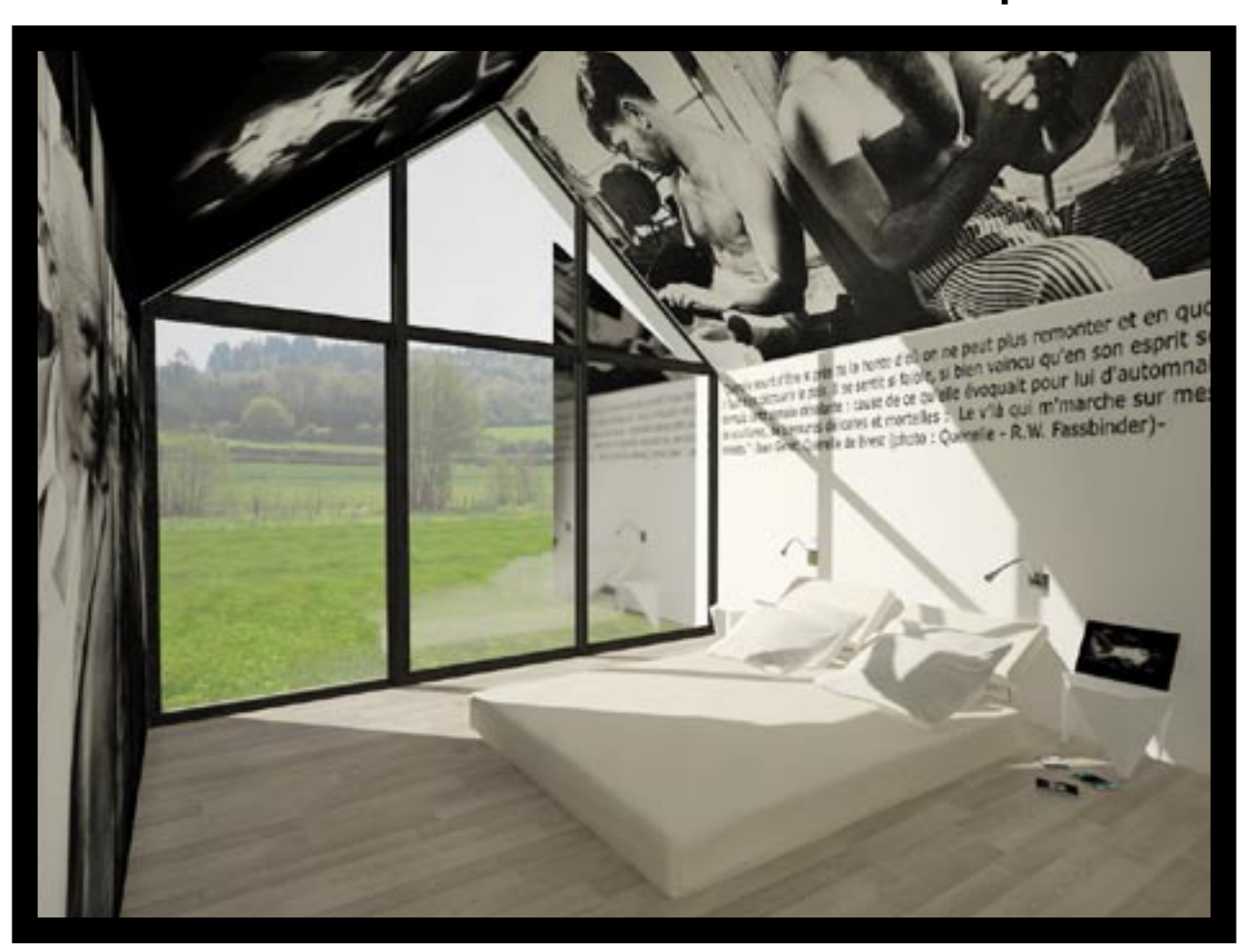
chambre «Jean Genet»

Les chambres d'hôtes: reprenant le volume de la « maison », elles ouvrent sur le jardin