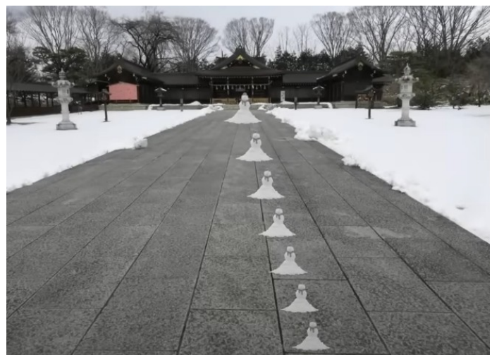
Celui du haut, obstinément, paraît plus grand