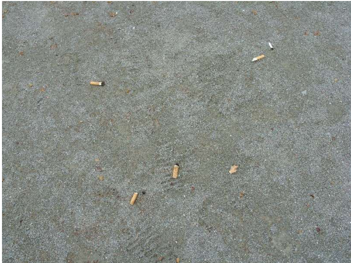
2009.05.01 NICE Championnat de France Crédit Agricole :