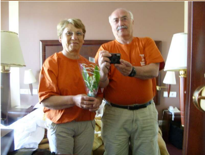
2009.08 ANGOULINS VETERANS :