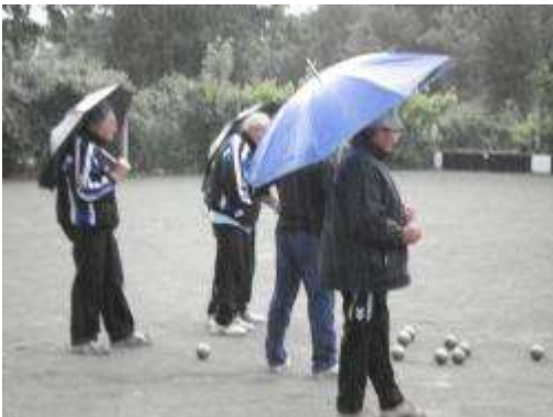
2009.09.11 CAFESOL SBS :