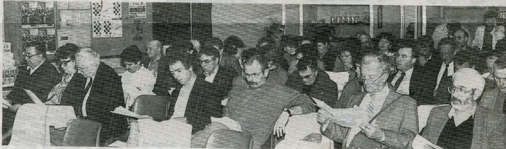
Entre représentants des différentes sections sportives et le bureau de l'OMS, les mots ont peut-être parfois dépassés les faits. (Photo 17)