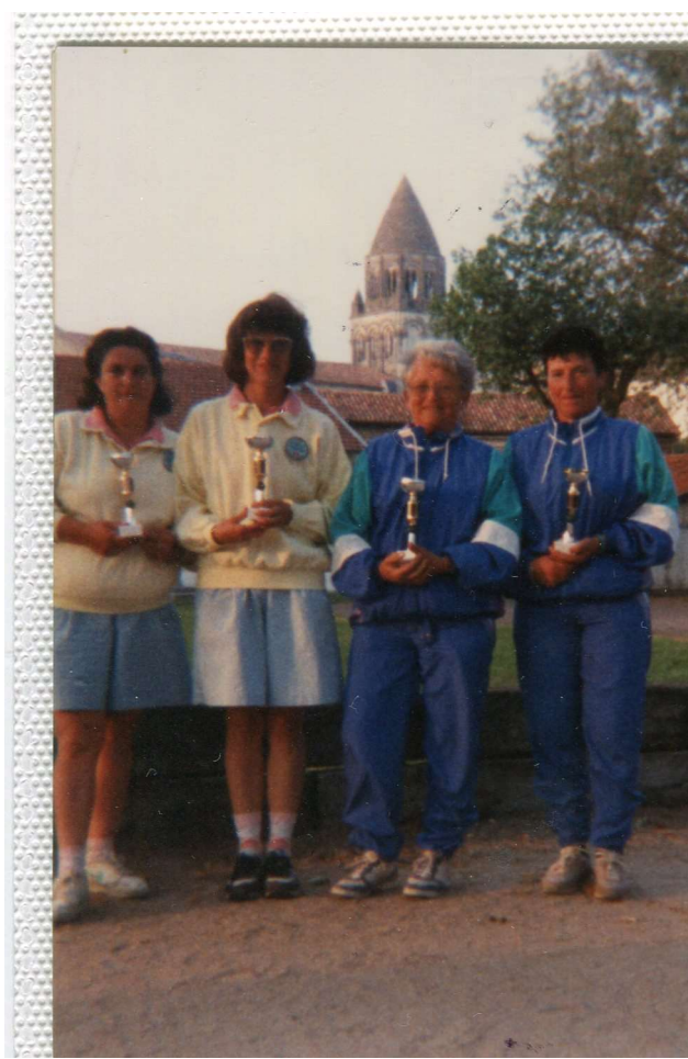
9 juin 1991, à ROYAN : Quadrettes CBD 17 CADETS :