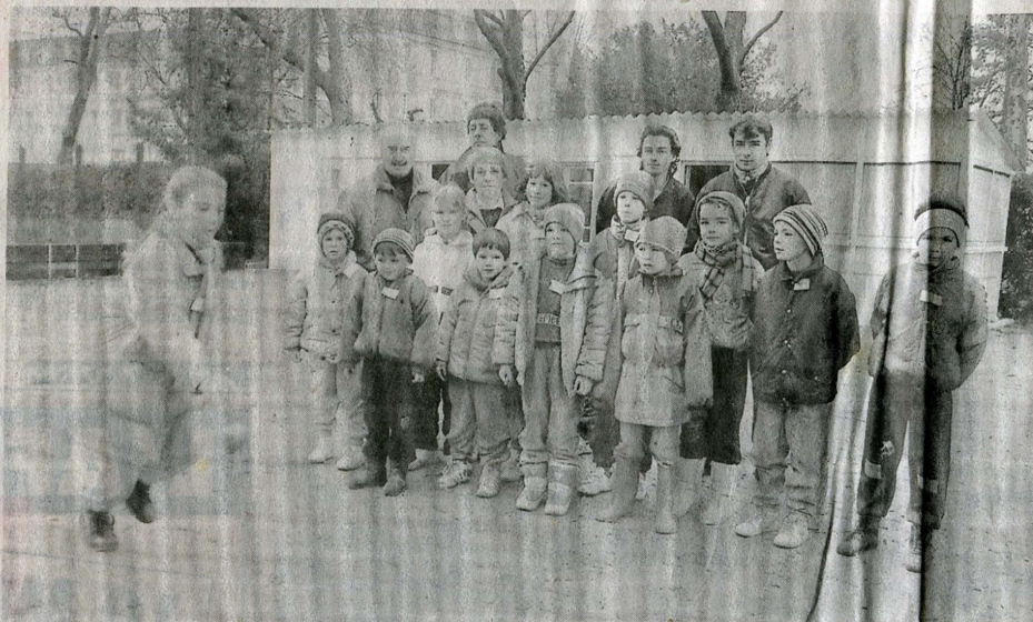
Sports Découverte, c'est l'apprentissage du sport. De tous les sports