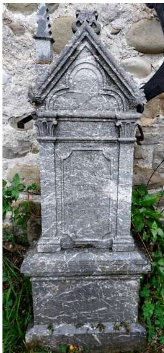
Ci-dessous : stèle funéraire aux inscriptions difficilement déchiffrables.