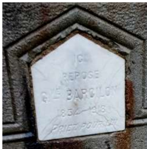
Ci-contre : Sépulture des époux BARCILON (détail ci-dessus).