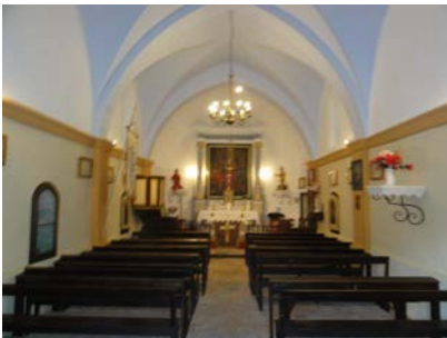
L'église avant et après sa rénovation

Après les discours, le verre de l'amitié a réuni l'assemblée autour d'un buffet.