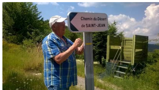
Le nouveau panneau en direction du Chemin du Désert de SAINT-JEAN, à Villevieille.

Espérons que ces nouveaux panneaux ne recevront pas de cartouches !