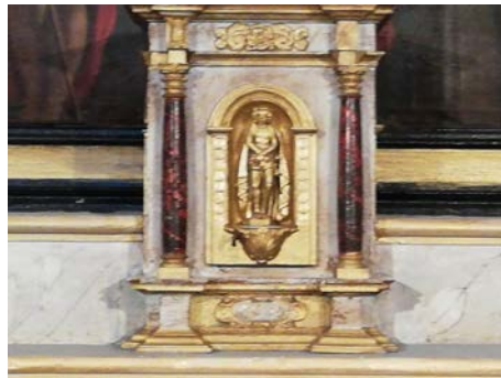
Le tabernacle restauré

Lors de la rénovation de l'église sainte Delphine, on a constaté que le tabernacle portait la datation de 1659. Or, comme on peut le constater sur l'extrait de cadastre Napoléonien datant entre 1810 et 1820, l'église n'existait pas à l'emplacement actuel mais se trouvait sur le cimetière (clocher). Ce tabernacle, et une porte datée de 1735, sont certainement (?) des réemplois venus de l'ancienne chapelle seigneuriale. Le graphisme du cartouche de datation est similaire à celui de la cheminée de l'appartement du second étage, et la date est la même.