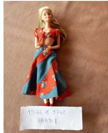
Barbie de collection offerte par Mme Geneviève BENECH