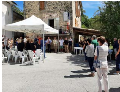
Célébration au monument aux morts