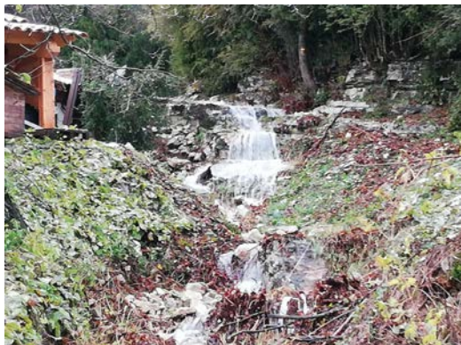
Le Tric en crue