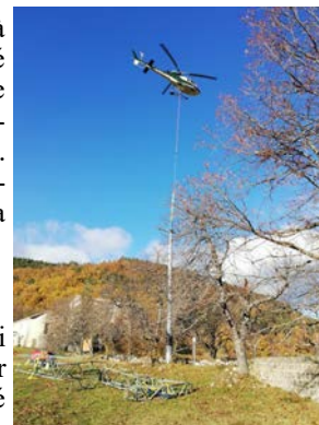
Mise en place du nouveau pylône par hélicoptère

Un grand merci aux équipes ENEDIS qui ont travaillé sans relâche afin de rétablir l'électricité sur toute la commune, malgré les conditions météorologiques défavorables.