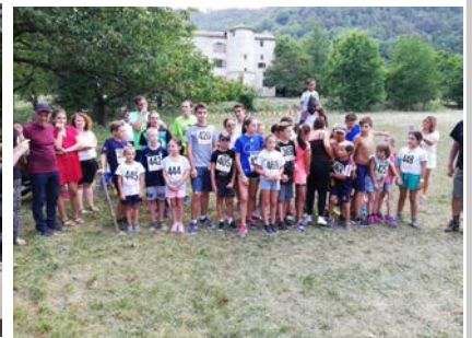
Départ de la course des enfants