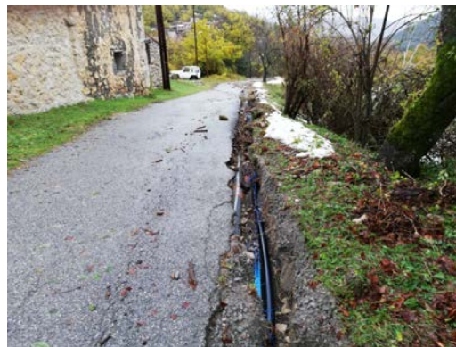
Dégâts sur la route de la montagne

L'épisode méditerranéen des 23 et 24 novembre a causé des dégâts sur la route de la Montagne, à Villevieille.