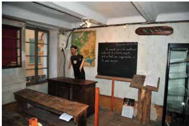
La salle de classe entièrement vidée

Grâce à ce chantier solidaire, la Maison Musée est entrée dans une démarche active et professionnelle de gestion de ses collections.