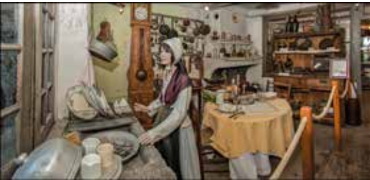
Cuisine de montagne

C'est un musée ethnographique : ses collections présentent la vie quotidienne, civile et religieuse, la vie militaire, les arts et traditions populaires, d'une aire géographique précise correspondant aux communes d'Allos, Colmars, Villars-Colmars, Beauvezer, Thorame-Haute et Thorame-Basse.