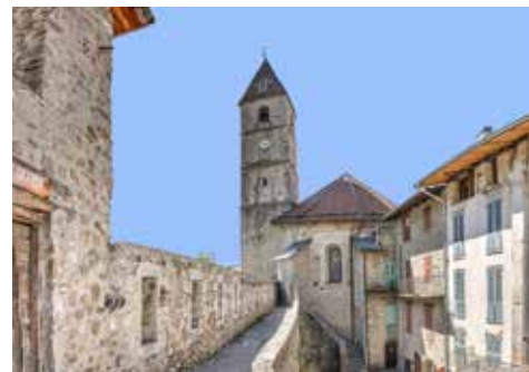
Chemin de ronde et clocher

Chargée de recherches Maison Musée Mairie de Colmars