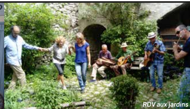
RDV aux jardins