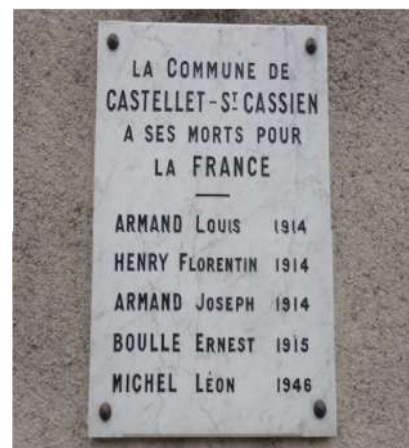
Plaques commémoratives des anciennes communes de Val de Chalvagne