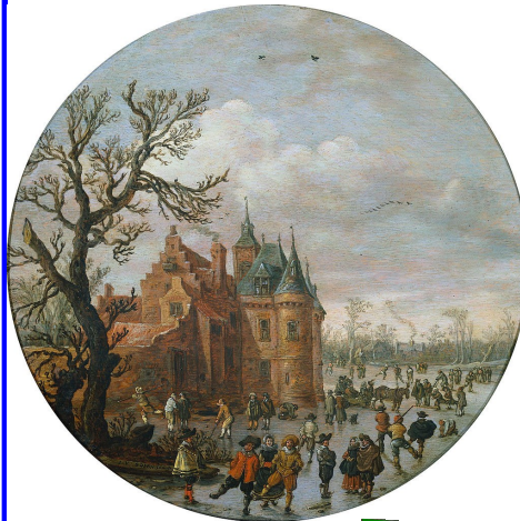
Yan Van Goyen -Hiver