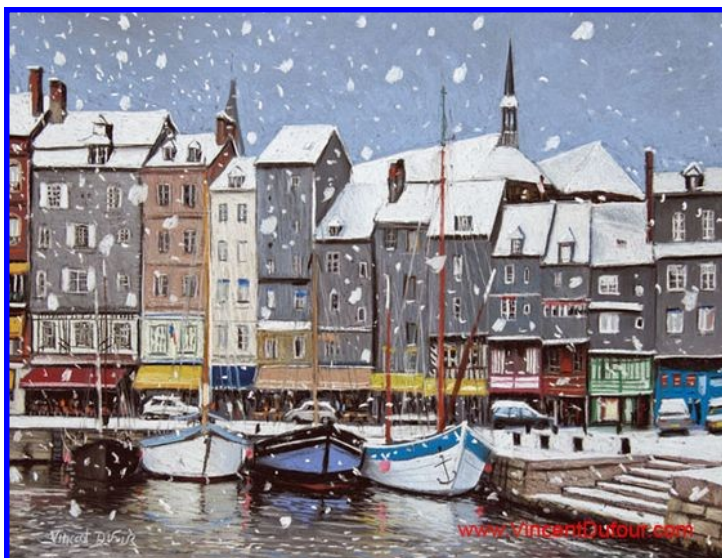
Vincent Dufour-Honfleur sous la neige