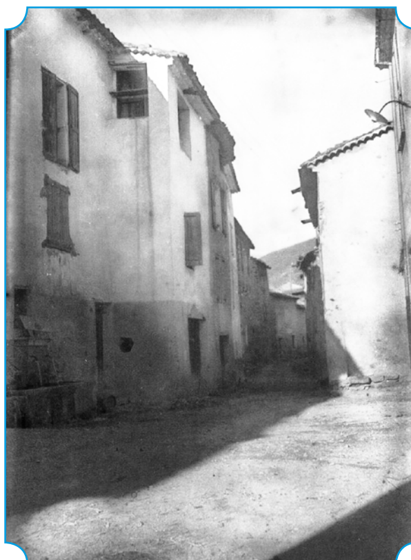
► La Grand Rue