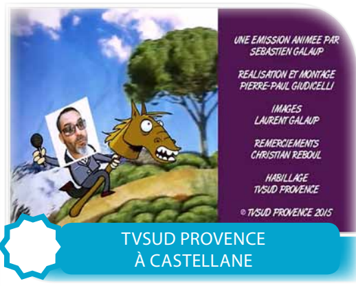
TVSUD PROVENCE À CASTELLANE

UNE ÉMISSION ANIMÉE PAR SEBASTIEN GALAUP RÉALISATION ET MONTAGE PIERRE-PAUL GUIDICELLI IMAGES LAURENT GALAUP REMERCIEMENTS CHRISTIAN REBOUL HABILLAGÉ TVSUD PROVENCE © TVSUD PROVENCE 2015