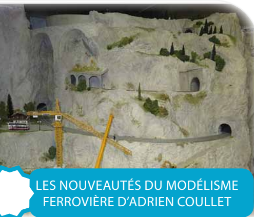
LES NOUVEAUTÉS DU MODÉLISME FERROVIÈRE D'ADRIEN COULLET