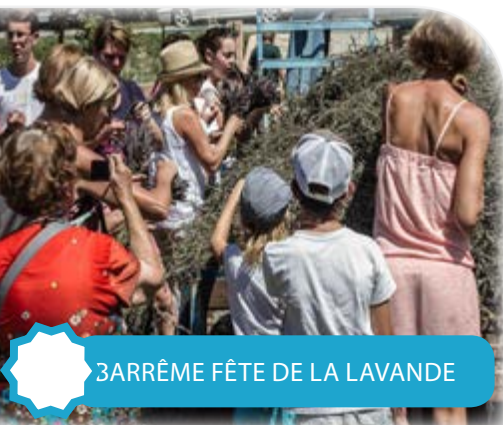
BARRÈME FÊTE DE LA LAVANDE