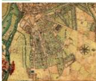
Géomorphologie du quartier du Busca Evolution historique Charles FERRON

Plus d'une cinquantaine du premier numéro des cahiers "Le Busca, quelle histoire ?" ont déjà été vendus lors des 25 ans de l'association le 4 octobre dernier.