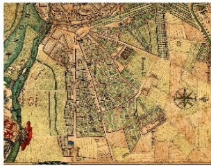
Cahier #0 Géomorphologie du quartier du Busca Evolutions historiques Charles MARION