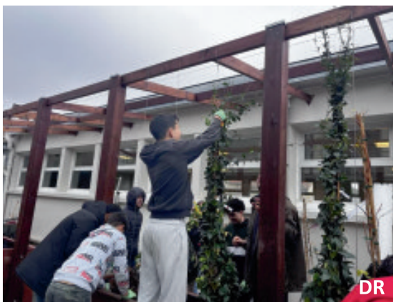
Étape 1 du projet : Les élèves mettent en place la pergola « pause fraîcheur » devant la cantine avec l'aide du CFA d'Auzeville

Beaucoup de nos demandes ont été retenues.