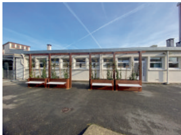
Étape 1 du projet : La pergola « Pause fraîcheur » est en place.

Le projet final nous plaît : les espaces sont bien pensés. Nous aurons davantage plaisir à être dans la cour lors des