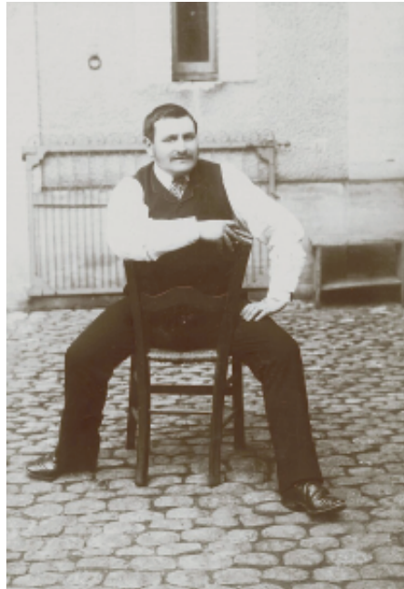
Photographie conservée au musée Georges-Labit

Autre hypothèse journalistique : il aurait été émasculé.