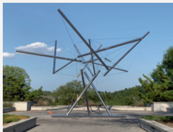
Sculpture en tenségrité réalisée par Kenneth Snelson

inaperçus. Ces quatre mats ne se touchent pas et sont reliés entre eux par des haubans.