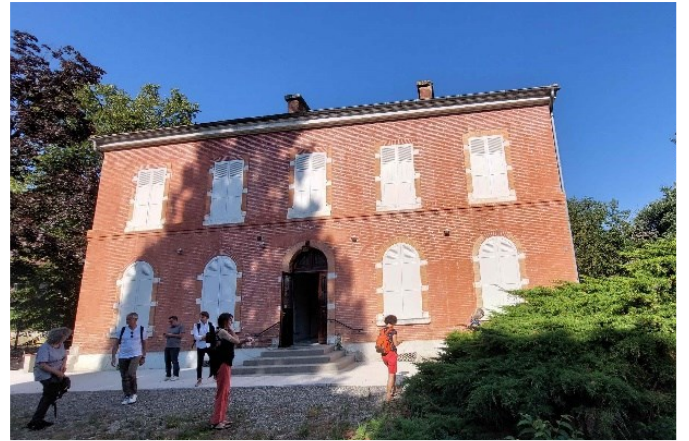
Maison du projet