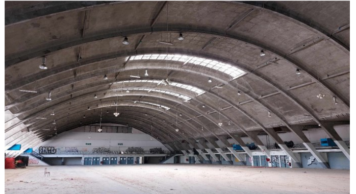
Hall 9 - intérieur