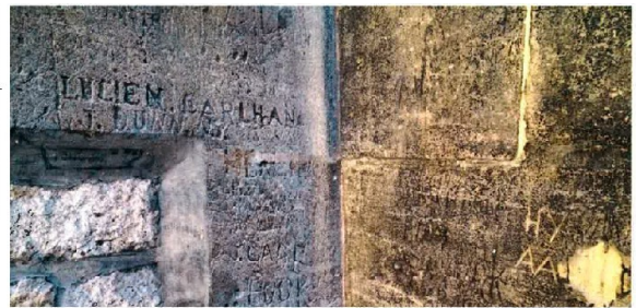
Bordeaux ancienne prison Bouliard