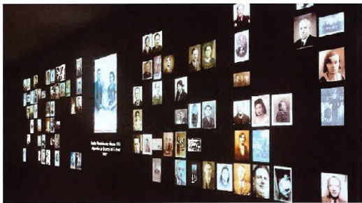
Drancy mémorial de la Shoah