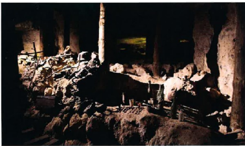
Musée du Chemin des Dames Effets personnels des soldats