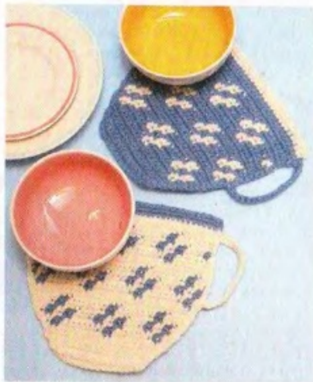
Эти очаровательные чашки можно использовать и как подставки под горячее.

Свяжите нитью белого цвета цепочку из 16 возд. п. + 2 возд. п. подъема. Далее вяжите по схеме ст. б/н, прибавляя столбики в конце и начале 3, 4, 5, 6, 7, 8, 9, 11, 13, 16-го рядов и меняя цвет нити с белого на синий. Закончив 31-й ряд, нитью белого цвета обвяжите левый край, дно чашки, отступив от начала 2 первых ряда, правый край чашки полустолбиками. Не обрывая нить, свяжите цепочку из 16 возд. п. и замкните ее в начало 19-го ряда. Получившуюся ручку обвяжите столбиками б/н. Нитью синего цвета свяжите 32-й, 33-й ряды, верх чашки обвяжите полустолбиками.