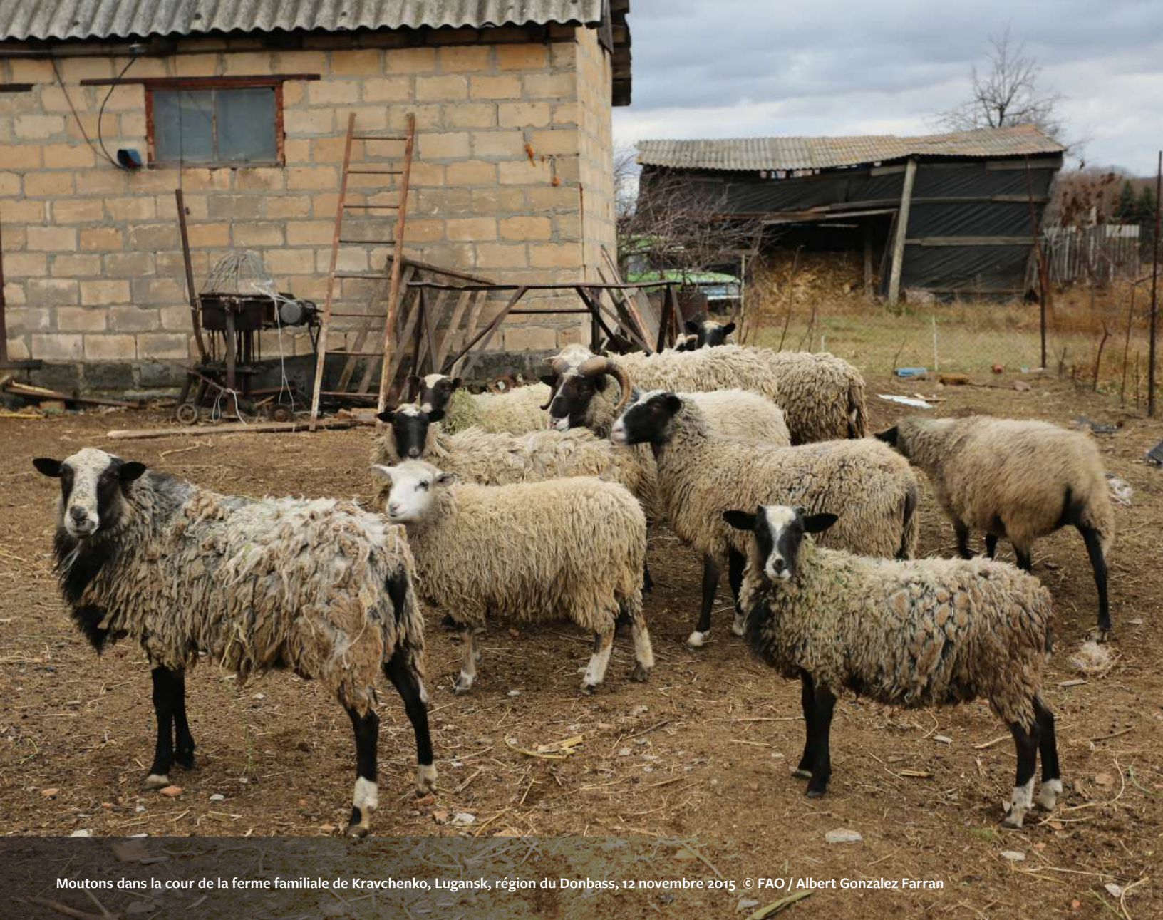
Moutons dans la cour de la ferme familiale de Kravchenko, Lugansk, région du Donbass, 12 novembre 2015

La Banque mondiale a justifié la création du marché foncier comme un moyen pour les petits agriculteurs d'accéder au financement. 176 Cependant, l'institution prévoit que les agriculteurs utilisent leurs propres terres et cultures comme garantie pour les prêts bancaires ou par le biais de garanties de crédit partielles, au lieu de les financer directement et de mettre en place des mécanismes financiers et institutionnels efficaces. 177 Depuis 2015, par l'intermédiaire de la SFI et en partenariat avec le gouvernement suisse, la Banque mondiale fait pression pour que les petits agriculteurs ukrainiens aient accès au financement grâce aux reçus de récolte. 178 Alors que la SFI affirme que les reçus de récolte ont permis à 2 000 petits agriculteurs d'accéder à un milliard de dollars de financement, cette somme d'argent