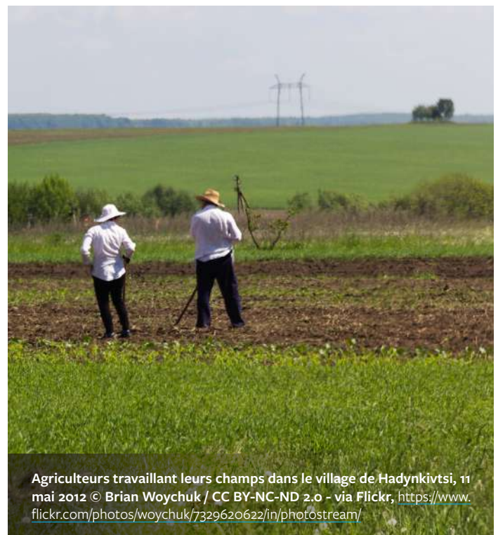
Agriculteurs travaillant leurs champs dans le village de Hadynkivtsi, 11 mai 2012

Ce qui précède peut servir de base à la transformation du secteur agricole en Ukraine afin de le rendre plus démocratique, plus durable sur le plan environnemental et social, d'une manière qui profite à la majorité de la population - en garantissant le droit à "une alimentation de haute qualité et sûre, produite dans le pays". 216 La politique internationale et le soutien financier devraient être orientés vers cette transformation, au bénéfice des populations et des agriculteurs, plutôt que de permettre la colonisation par les oligarques et les intérêts financiers étrangers. 217