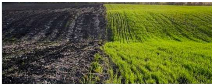
Friends in the Dnepropetrovsk region, Ukraine. Inefficiently managed resources, including agricultural land, remain a drag on growth