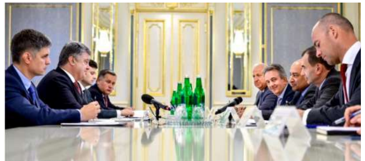
The EBRD delegation meets Ukraine's President Poroshenko in Kiev.

Capture d'écran du site web de la BERD, https://www.ebrd.com/news/2017/ebrd-president-urges-ukraine-to-continue-reforms.html