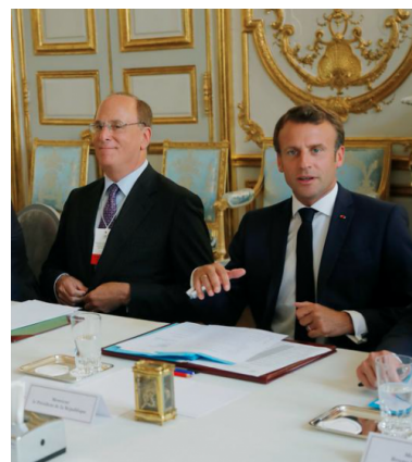
Larry Fink (BlackRock) et Emmanuel Macron à l'Élysée en juillet 2019

la France et de l'Europe ». Macron « bluffe l'homme le plus puissant de Wall Street », écrira quelques semaines plus tard Challenges .