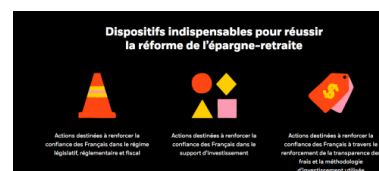
Les recommandations de BlackRock en images.

C'est cette gestion risquée de l'épargne que le gouvernement français accepte de soutenir dans sa promotion de la capitalisation. Officiellement, cela est censé aider le développement de l'épargne productive et le financement des PME. Mais les demandes de BlackRock au gouvernement vont tout à fait dans un sens opposé. Les produits d'épargne retraite, promus dans le cadre de la loi Pacte, doivent s'inscrire, recommande le gestionnaire, dans le cadre de la directive Juncker sur l'épargne paneuropéenne. Dans ce cadre, « la liste des investissements éligibles aux dispositifs d'épargne salariale gagnera à être étendue aux SICAV de droit étranger. [...] Un grand nombre de gestionnaires d'actifs ont des gammes de fonds domiciliées au Luxembourg ou en Irlande, qui sont aujourd'hui exclues de cette offre. » Deux pays à la fiscalité "compréhensive". En d'autres termes, il faut faciliter l'évasion fiscale et la fuite des capitaux. Sans que cela fasse frémir un seul responsable.