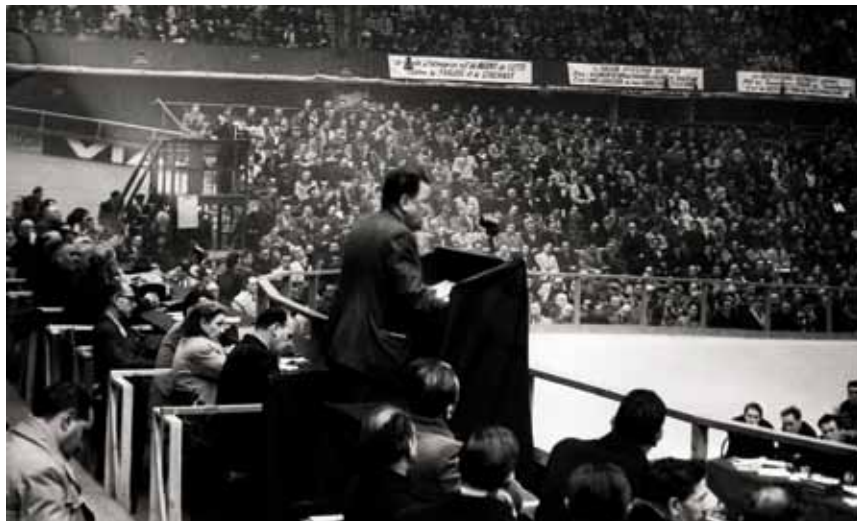
Première conférence nationale des CE au Vélodrome d'hiver à Paris, en avril 1948, avec Benoît Frachon.

Pendant la guerre, le régime de Vichy supprime rapidement les libertés syndicales et institue une Charte du travail. Celle-ci met en place des «comités sociaux d'entreprise», plus connus sous le nom de «comités patates» du fait de leur rôle surtout alimentaire. Ces comités n'ont bien entendu