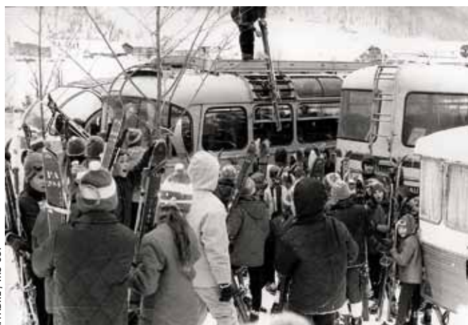
R. FABRE / IHS-CGT

Une grande offensive pour affaiblir le Code du travail est lancée.