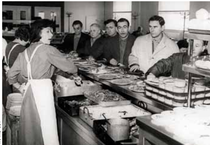
DR / IHS-CGT

Départ aux sports d'hiver, financé par le comité d'entreprise de la SNAPA.