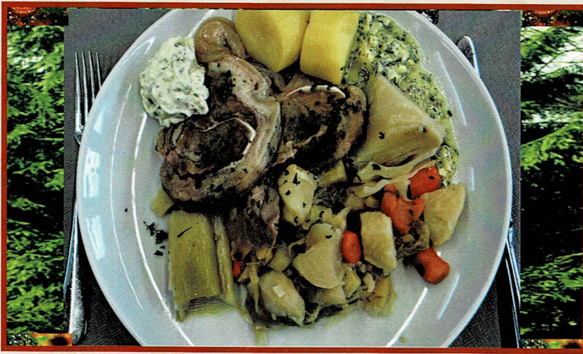
L'assiette « Tête de Veau » pour notre ripaille de fin d'année, confectionnée par les Chefs Cuisiniers de notre Confrérie.