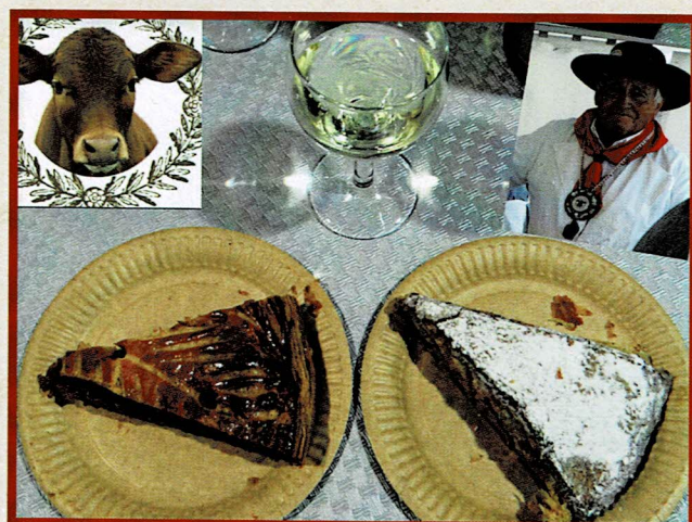
Traditionnelle galette des Rois, le veau couronné !