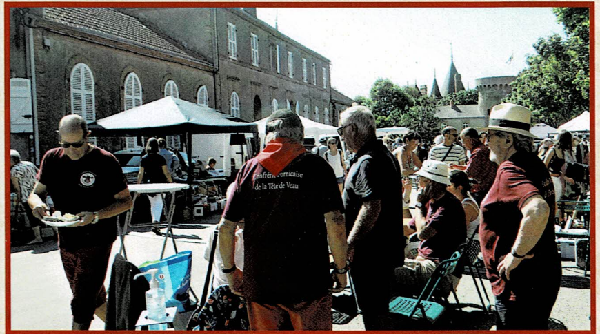
Grand soleil, et affluence au vide grenier organisé par la Confrérie et les commerçants du « Haut de Pornic » sur la Place de la Terrasse à Pornic