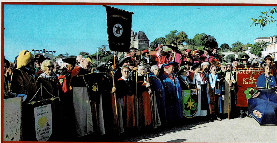
Promenade champêtre à travers la Ria lors de la semaine du défi des Ports de Pêche