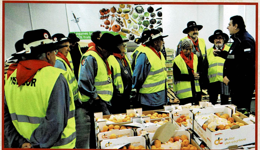
Visite du M.I.N. de Nantes, belle démarche pour apprécier la qualité des produits