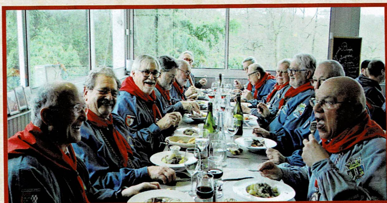
Les Confrères testent la tête de veau des restaurateurs du Pays de Retz pour décerner le prochain Vitellus d'Or