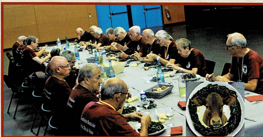
Ripaille conviviale autour de la Moule de la Plaine