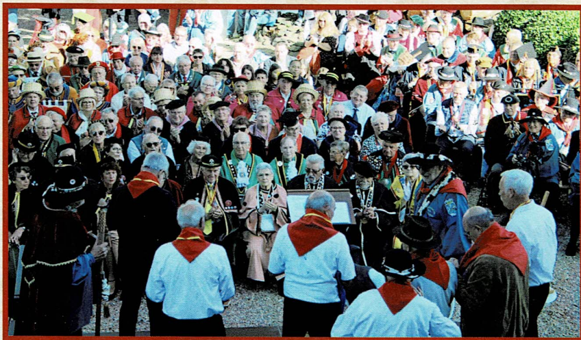
Rendez-vous annuel des Confréries à Pornic lors de notre 10 e Grand Chapitre. Quarante-deux Confréries présentes.