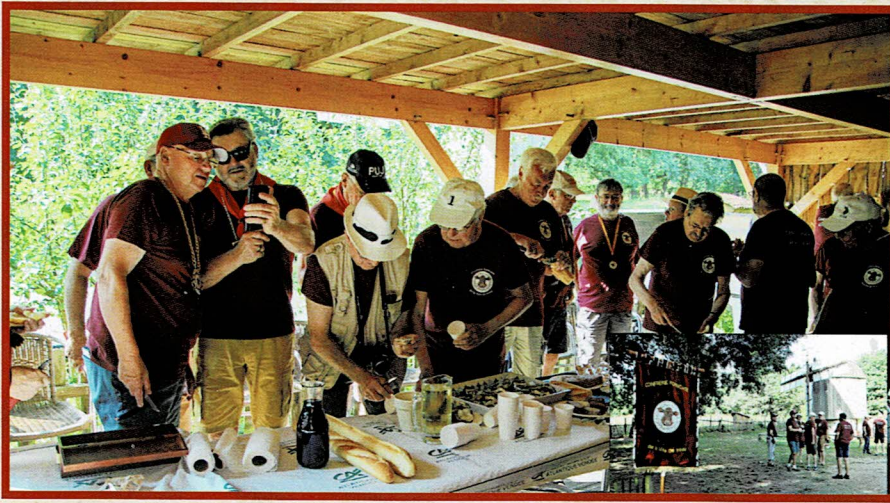
Le casse-croûte : mieux vaut prendre des forces pour débiter le tournoi de pétanque.