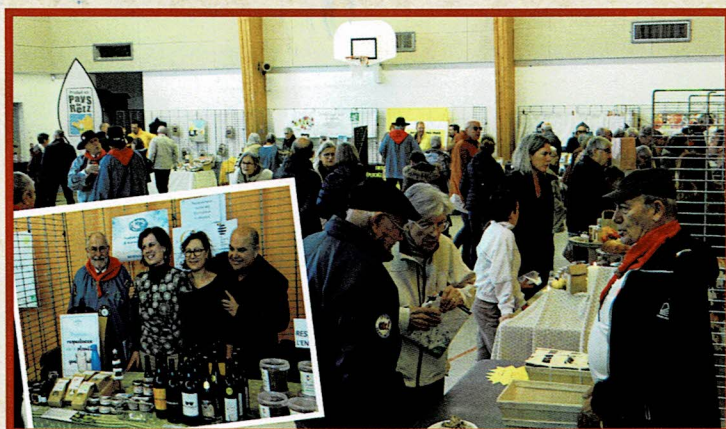
Beau succès de notre salon des Producteurs et Savoir-Faire du Pays de Retz. Une vingtaine d'artisans ont présentés leurs produits.

S'en est suivi un repas « Tête de Veau » ouvert au public de 130 couverts