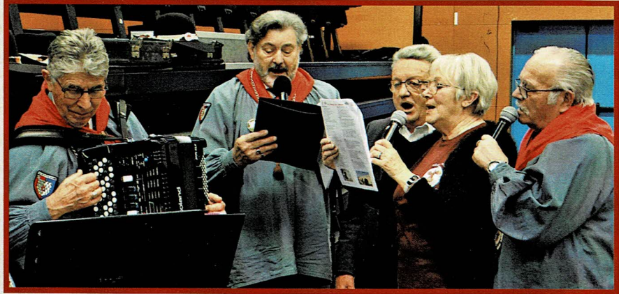
Quand le Chœur de Veau chante le Pays de Retz