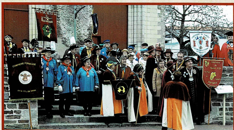
Visite de nos représentants aux Grands Chapitres des Confrérie amies, ici à la Confrérie du Canard du Pays de Challans