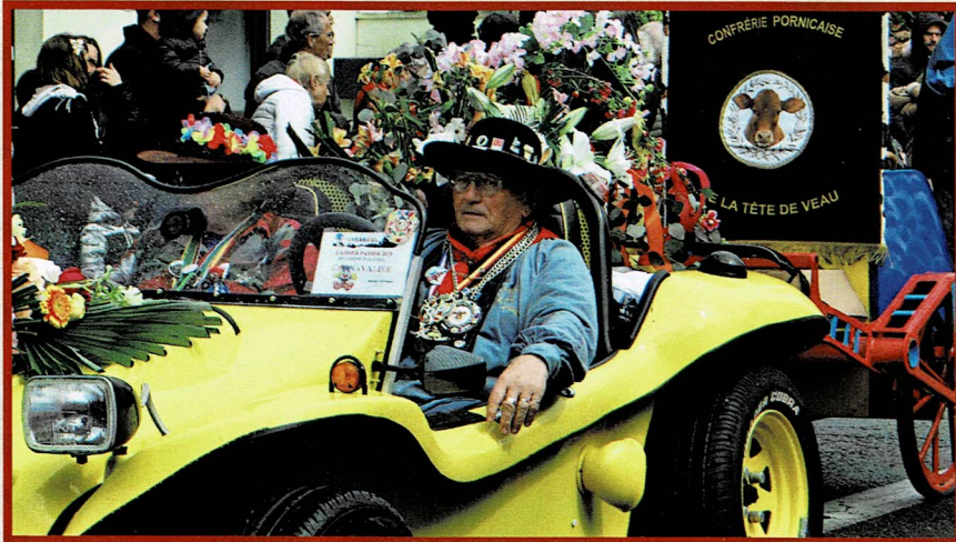
Ouverture du Carnaval et distribution des catalogues par les « Veaux »