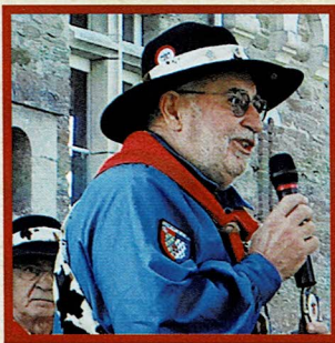
Le mot du Grand Maître sous le ciel bleu pornicais

Notre Pays de Retz regorge d'artisans-producteurs talentueux et la diversité de ses produits est une chance pour notre territoire. Nous nous efforçons de les découvrir et de les faire connaître en sillonnant nos marchés, nos commerces, les salons et les sites de production et de restauration. Qu'ils soient ostréiculteurs, conchyliculteurs, éleveurs, cultivateurs, maraichers, pêcheurs, vigneron... Ils ont à cœur d'éveiller nos papilles par la qualité et la transformation de ces produits. Les confréries rabelaisiennes sont attentives aux traditions culinaires, aux recettes ancestrales et aux produits des terroirs authentiques. En bref au bien manger. Récemment, le ministère de la Culture vient de reconnaître les confréries au patrimoine culturel immatériel des français, et c'est aussi grâce à eux. Forts de notre existence de plus de dix ans, la tête de veau reste notre étendard derrière lequel nous aimons rallier toute la production culinaire du Pays de Retz qui exhause saveurs et délices.