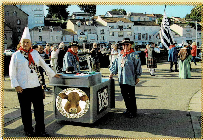
La « Popote » est fière de transporter la Tête de Veau qui sera dégustée par les badauds sur le Môle