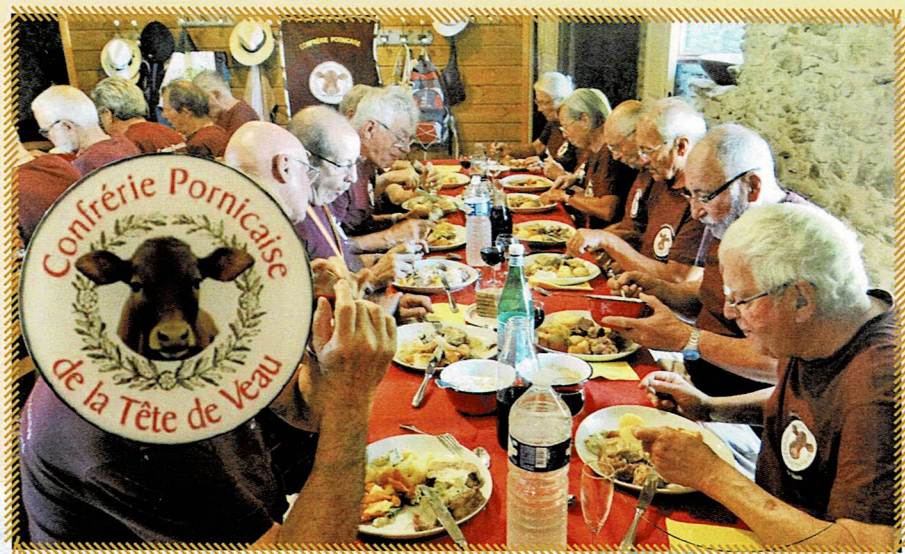
Ripaille traditionnelle dans une « étable » qui regroupe une cinquantaine de « Veaux » après un tournoi de pétanque âprement disputé