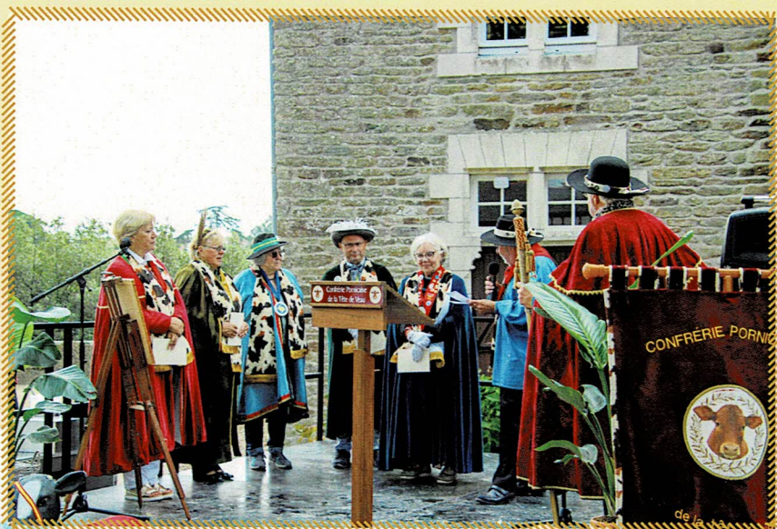
Cérémonie d'Intronisation de Confrères dans la cour du Château lors de notre Grand Chapitre