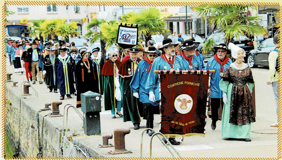
Défilé des Confréries sur les quais de Pornic entraîné par la Pornicaise