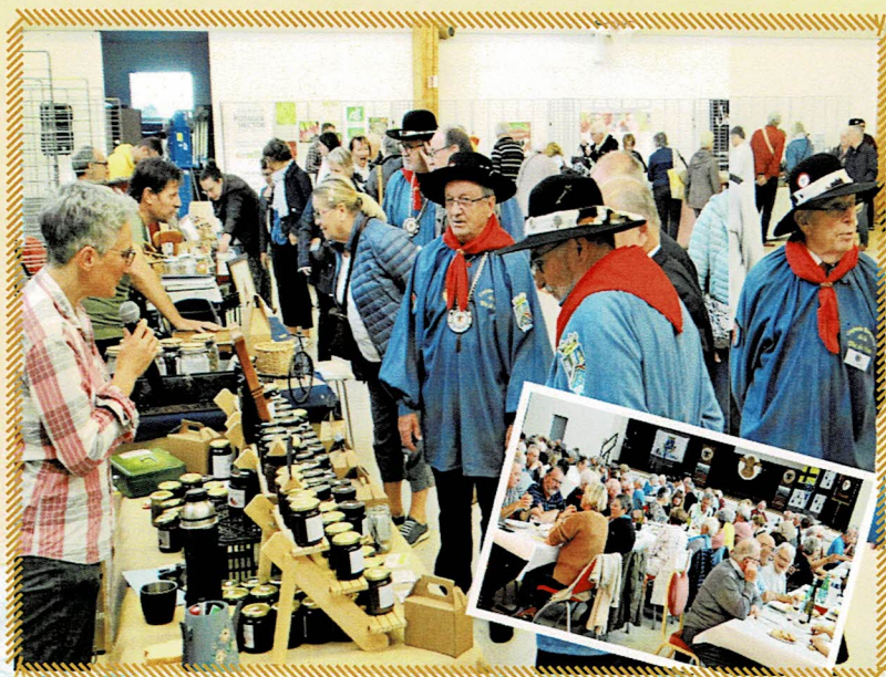
Les artisans-producteurs du Pays de Retz sont fiers de présenter leurs produits à notre Confrérie, organisatrice de ce premier salon. Un banquet « Tête de Veau » s'en est suivi