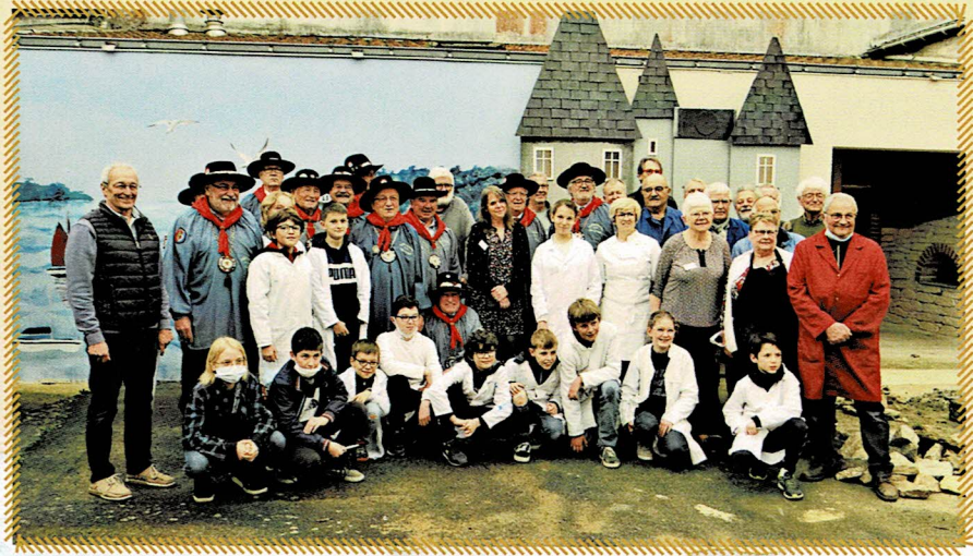
La Confrérie lors de sa visite à l'association « L'Outil en Main ». Soutien apporté aux bénévoles et aux enfants pour que leur activité perdure