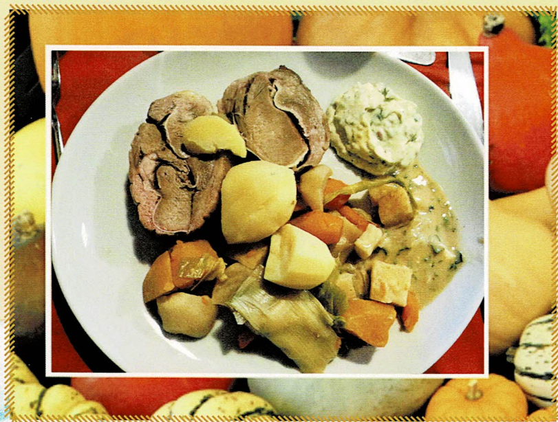
Belle assiette de Tête de Veau roulée, sauces gribiche et ravigote, légumes du potager