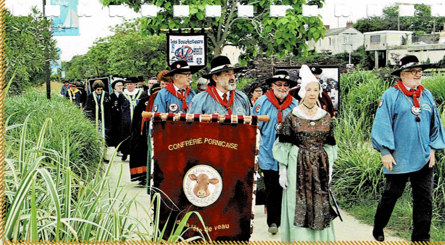
Promenade champêtre à travers la Ria lors de la semaine du Défi des Ports de Pêche