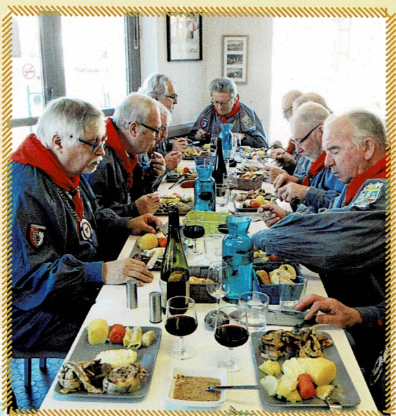
Dégustation dans l'un des restaurants du Pays de Retz qui recevra peut-être la distinction décernée par la Confrérie : le Vitellus d'Or