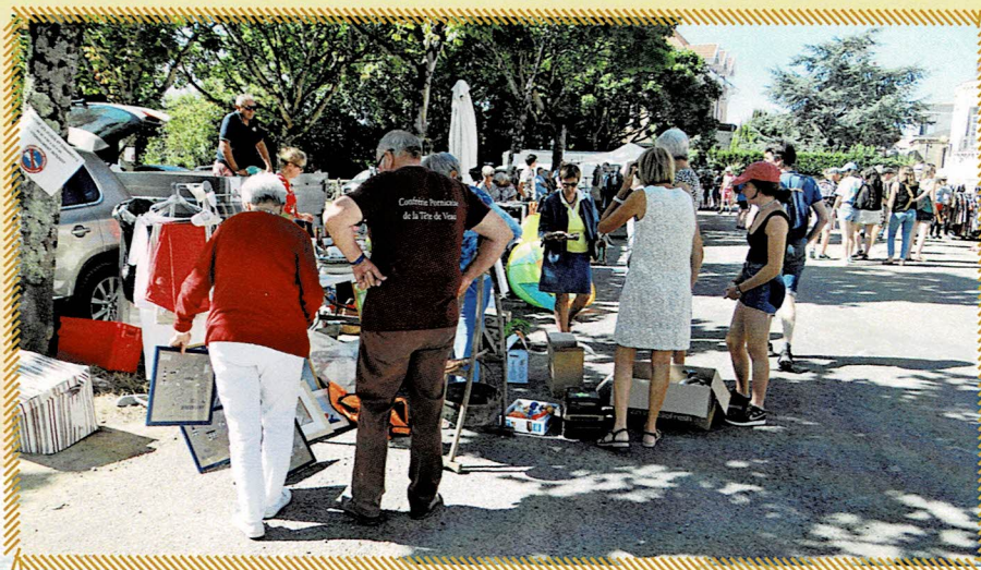
Les chineurs étaient au rendez-vous de la brocante organisée par la Confrérie sur la Place de la Terrasse à Pornic