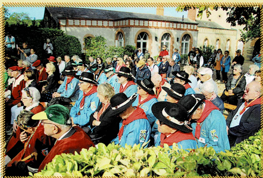
Revêtus de leurs « biaudes » et de leurs chapeaux noirs, les « Veaux » attentifs lors de la cérémonie d'intronisation au Château de Pornic