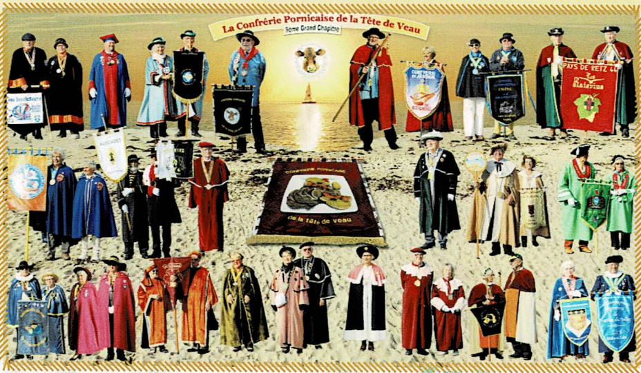
Quelques tenues, hautes en couleur, des Confréries qui participent régulièrement à notre Grand Chapitre