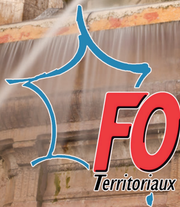
Saint-Michel Fountain - Nicolas Raymond - freestock.ca

Assistant de conservation Assistant de cons. principal de 2 ème classe Assistant de cons. principal de 1 ère classe