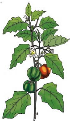
Dessin de notre illustrateur malgache, Nino, utilisé dans nos futurs posters "Nutrition".

Ici, l'aubergine africaine ( Solanum aethiopicum )