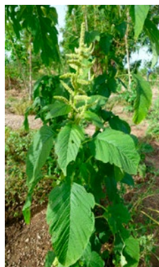
Amaranthus sp., légume feuille très apprécié au Burkina Faso

Pour faire une sauce à base de feuilles d'amarante – Amaranthus sp. (« zibilé » en mooré), d'oseille – Hibiscus asper (« bito » en mooré) et d'aubergine africaine – Solanum aethiopicum (« kumba » en mooré), on sait désormais qu'on trouve tous les ingrédients frais sur le marché en janvier. Au contraire, il faudra attendre quelques mois pour intégrer Cleome gynandra (« kennebdo » en mooré) dans notre sauce à base de feuilles. Ces informations permettent de consommer des produits cultivés localement, riches en nutriments durant toute l'année.