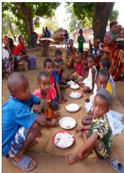
Enfants partageant malheureusement uniquement des plats de riz, village de Madirobe, Madagascar

En 2011, on enregistrait près de 165 millions d'enfants souffrant d'un retard de croissance, causé par une alimentation insuffisante et/ou pauvre en vitamines et en nutriments. Selon l'OMS, près de 1,5 millions d'enfants sont victimes des conséquences de la malnutrition à travers le monde. Les prix des denrées alimentaires, les pénuries, les catastrophes naturelles, l'augmentation du coût de la vie, ou les crises socio-politiques sont autant de facteurs qui aggravent la situation. Au moins 2 milliards de personnes dans le monde, dont un tiers d'enfants, présentent des avitaminoses ou carences en zinc, fer et iode.