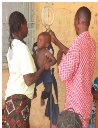
Pesée d'un enfant par nos relais villageois, Poun, juin 2017

Nous y avons débuté nos activités « Nutrition » fin 2015 : le taux de malnutrition y était bien trop élevé. Chaque année il diminue grâce au suivi rapproché des personnes relais présentes chaque jour sur le terrain.