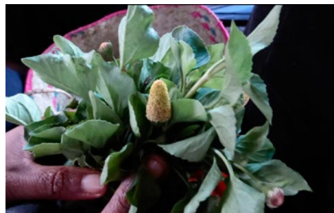
Acmella oleracea, légume feuille très apprécié à Madagascar

Afin de valoriser les légumes feuilles, comme au Burkina Faso, nous effectuons un inventaire des espèces présentes localement dans les marchés. Ce travail est assuré, en grande partie, par une nouvelle équipe « Nutrition » composée de Nina et de Clémentine.