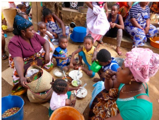
Partage d'un repas familial dans un village du Nord de Madagascar, août 2017

Dans le Nord de Madagascar, les problèmes de nutrition sont moins importants que dans la région du Sahel, zone plus humide où on trouve de nombreuses espèces de fruits et légumes. Cependant, certaines maladies peuvent indirectement être causées par un manque d'hygiène lors de la préparation de repas, ou par une alimentation trop riche en riz mais pauvre en légumes feuilles. Dans les centres de santé, on recense bon nombre de cas de diarrhée, notamment chez les bébés et enfants en bas âge, ainsi que des cas de diabète ou d'hypertension chez les patients plus âgés.