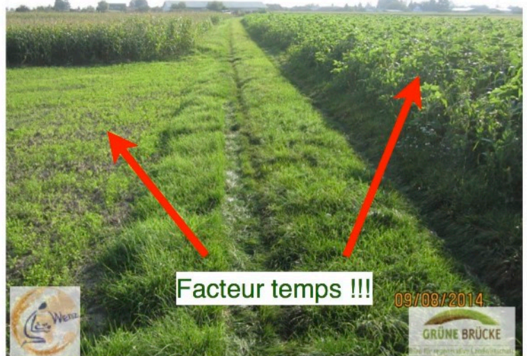
Facteur temps !!!

Les couverts de l'été : notre usine chimique !