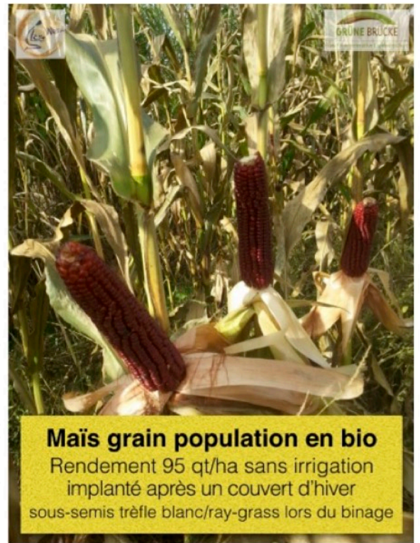
Maïs grain population en bio Rendement 95 qt/ha sans irrigation implanté après un couvert d'hiver sous-semis trèfle blanc/ray-grass lors du binage