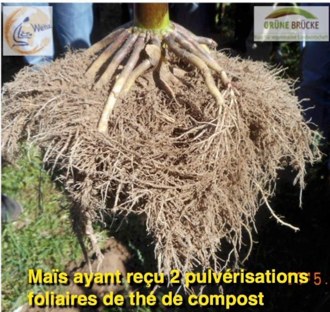
Maïs ayant reçu 2 pulvérisations 5 foliaires de thé de compost

Les couverts de l'été : notre usine chimique !