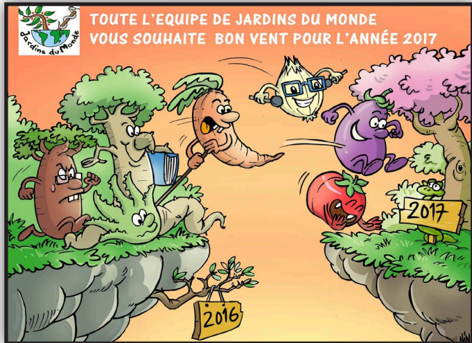
Illustration de Nino, Antsirana, 2016

JdM vous souhaite de joyeuses fêtes de fin d'année !!!