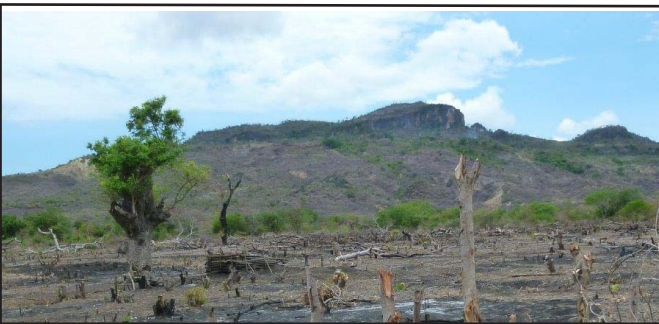
Aire de charbonnage, Betathitra, novembre 2016

Une habitante du village nous a fait découvrir un chantier de production de charbon de bois. Cette activité contribue à la déforestation de Madagascar. Ici, il n'y a pas beaucoup d'autres possibilités de revenus vu la nature du sol. Jean-Pierre cherche des solutions pour la production de plantes médicinales destinées à l'exportation.