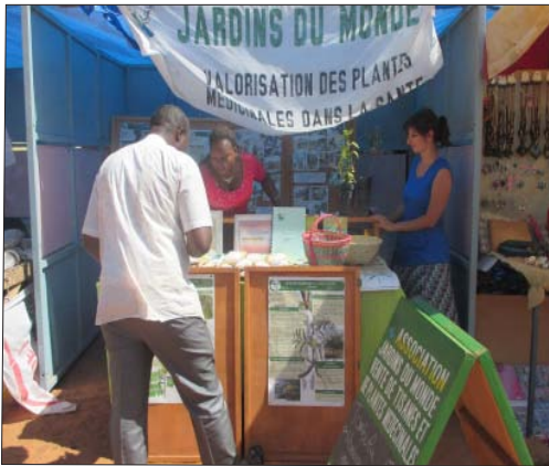
Stand JdM au festival des Nuits atypiques de Koudougou, novembre 2015

Novembre 2016, me voici en route pour une prise de poste en tant que coordinatrice à JdM Madagascar, après une escale en Suisse, mon pays d'origine. Dans mes bagages, j'emporte les nombreux cadeaux des villageois et des collègues. Cette expérience m'a appris à faire preuve de patience, de résilience et d'ouverture. Elle m'a permis de rencontrer des personnes attachantes qui ont témoigné leur reconnaissance envers JdM. « Barka », « annabana » (« merci » en mooré et liélé) sont des expressions en langues locales qui sont répétées régulièrement par les participants à nos différentes activités, notamment à la fin des formations.