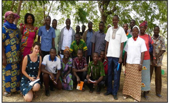
Photo de groupe lors d'une formation sur l'usage de plantes médicinales au jardin pédagogique de Kassou, janvier 2016

Ensemble, nous avons mené à bien les différentes activités définies dans le plan d'action, en organisant des formations sur l'usage des plantes médicinales dans les villages et au jardin de Kassou, en aménageant les différents jardins de plantes médicinales et alimentaires, en valorisant les aires protégées, en creusant de nouveaux puits etc.