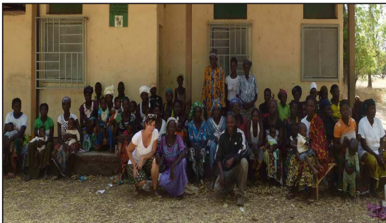
Rencontre au village de Mogueya avec les participants aux activités, novembre 2016

Nos premiers échanges débutent autour d'un plat de tô sauce oseille. Je suis rapidement plongée dans les activités de JdM avec les visites successives des villages. Tous les jours, je découvre une nouvelle activité qui m'enthousiasme.