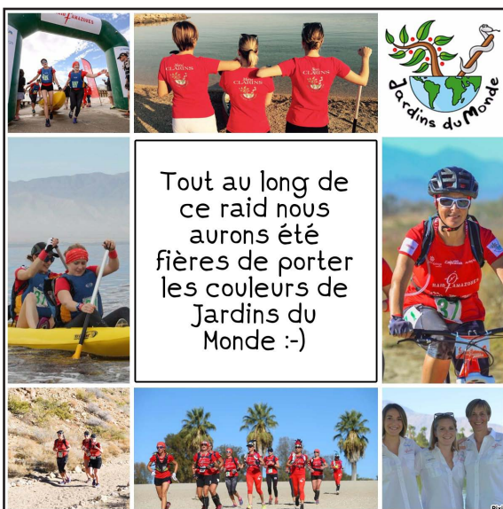
Les Amazones, Raid 2016

Pour nous donner les moyens d'écrire cette belle histoire, nous avons vécu 6 mois de préparations intenses ponctués de moments de partage forts en famille. Finalement, grâce à Clarins, à notre investissement quotidien, au soutien inconditionnel de nos proches et à l'association Jardins du Monde, nous avons construit un magnifique projet qui restera gravé dans nos mémoires.