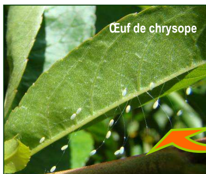
Œuf de chrysope

Les chrysopes pondent des œufs blancs à verdâtres et allongés, d'environ 2mm de long, à proximité des foyers de pucerons. Les oeufs sont disposés au bout d'un fil car à leur sorties, les larves sont tellement voraces qu'elles se mangeraient entre elles.