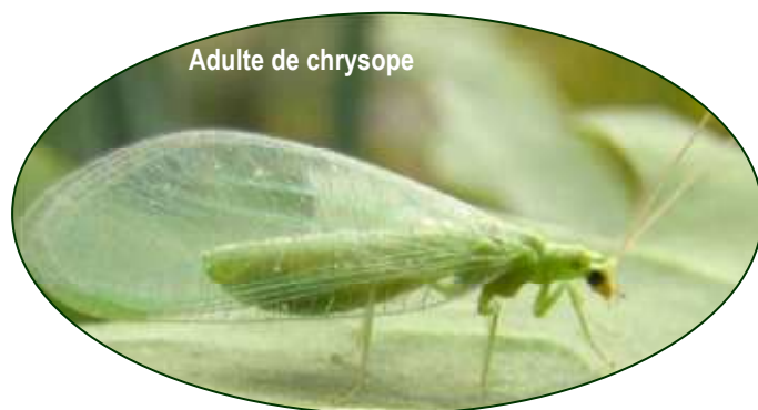
Adulte de chrysope

Les chrysopes adultes sont attirés par le nectar et le pollen; la présence de fleurs favorise leur venue et leur prolifération. Pouvant atteindre 2cm, ils sont reconnaissables avec leur grandes ailes translucides laissant apparaître leur corps souvent vert clair.