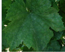
Oïdium sur feuille (Photo CA31)

Il faut être attentif à son apparition sur feuilles sous forme de taches grisâtres (feutrage sur la face inférieure puis supérieure lorsque le cas s'aggrave comme ci-dessous).