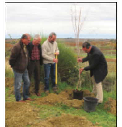
Le premier arbre planté en Côtes de Thongue

L'objectif final est d'entraîner dans cette expérience humaine et environnementale l'ensemble des vigneron des IGP de l'Hérault pour que cette démarche soit largement diffusée et valorisée sur le territoire dans les années à venir.