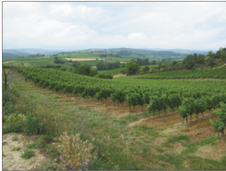
Association de vigne et d'Infrastructures Agro-Ecologiques sur le vignoble limouxin (source : CA 11)

Malgré tout l'intérêt de ces progrès et l'attente qu'ils suscitent, l'appauvrissement de la biodiversité associée au vignoble intervient à une telle allure qu'il convient d'entreprendre des méthodes de protection complémentaires, basées sur une meilleure gestion du par-