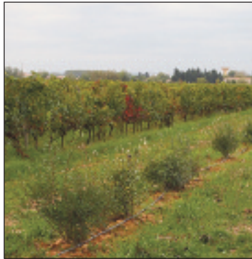
Jeune haie constituée d'espèces caduques et persistantes.

Outre sa fonction de ressource nutritive, une haie joue le rôle d'habitat pour de nombreux mammifères et insectes. Associer des espèces caduques à des espèces persistantes est un moyen d'assurer cette fonction d'habitat lors de la saison hivernale particulièrement critique pour certains individus qui nécessitent un abri dans l'attente du printemps. L'emplacement de la haie doit être judicieusement choisi de manière à optimiser ses fonctions agronomiques et limiter les gênes qu'elle pourrait occasionner pour le viticulteur. Dans les zones de coteaux, les haies doivent être implantées perpendiculairement à la pente de manière à jouer pleinement leur rôle de maintien des sols face à l'érosion. Le viticulteur peut par exemple profiter d'un large bord de chemin pour y installer sa haie afin que celle-ci ne gêne pas le passage des engins agricoles.