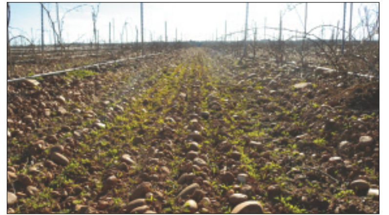
Récents semis de graminées, légumineuses et "messicoles" sur une jeune vigne irriguée des Costières de Nîmes

Dans le vignoble du pourtour méditerranéen, sujet à une forte contrainte hydrique en saison sèche, l'enherbement apparaît souvent