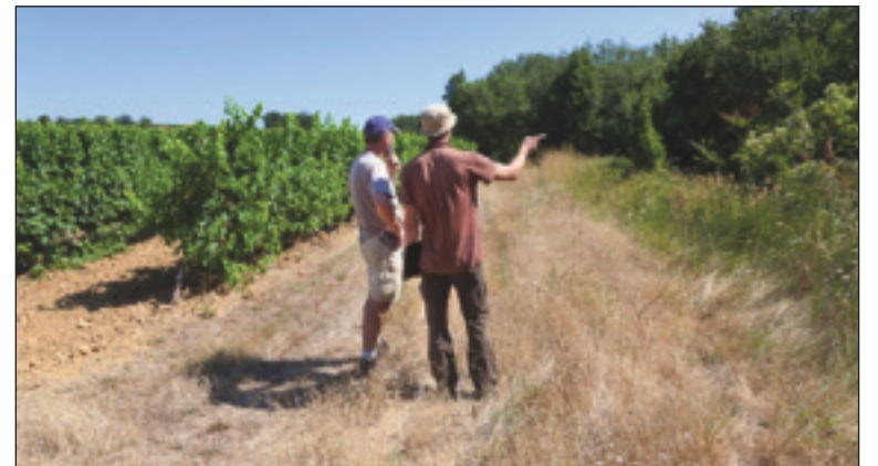
Formation à la phase d'autodiagnostic

En chiffres : 463 hectares inventoriés, 3 300 mètres linéaires de haies plantées et 45 arbres isolés plantés ; 3 ha de milieux ouverts restaurés, depuis le lancement du projet il y a un an. Cette démarche permettra, entre autre, de contribuer à la durabilité de la filière viticole sur le territoire et valorisera en même temps son image. Pour 2013, le projet s'étend à d'autres sections IGP et intègre désormais la prise en compte de la qualité de l'eau. 90 viticulteurs vont être formés cette année.