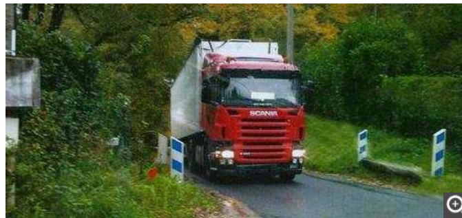
C'est ce genre de camion qui emprunte ces petites routes.

Dans un communiqué l'association Bien Vivre à Nazelles-Négron s'inquiète sur l'évolution de cette entreprise et les conséquences en terme de nuisance : Augmentation du trafic routier de 2,6 % suite à la future exploitation d'un bio-déconditionneur de bio-déchets, sur le trafic des tracteurs-épandeurs, mais également conséquences sur les nappes phréatiques et les odeurs pour les riverains. Fin 2009 un comptage journalier de camions avait été déjà réalisé sur la petite route qui relie Nazelles à cette usine. Dans le sens Nazelles-Chancay il avait été compté 30 camions, et 25 dans l'autre sens. Pour le président de l'association « Cette situation est inacceptable et il est grand temps que les pouvoirs publics prennent leurs responsabilités pour protéger ces vallées victimes de la circulation et de ces odeurs nauséabondes. Il faut à tout prix délocaliser cette entreprise loin des habitations et sur un grand axe routier » et il menace d'aller plus loin « faute de quoi des actions seront mises en place, car la colère commence à nous monter au bonnet ». De son côté la mairie a demandé à la préfecture que la circulation des camions dans le centre bourg, soit limitée à 19 tonnes. D'autre part les associations de chasseurs et exploitants de Nazelles tirent la sonnette d'alarme sur les séquelles que cela occasionnerait sur la reproduction des faisans, perdrix, lapins... et sur la faune sauvage.