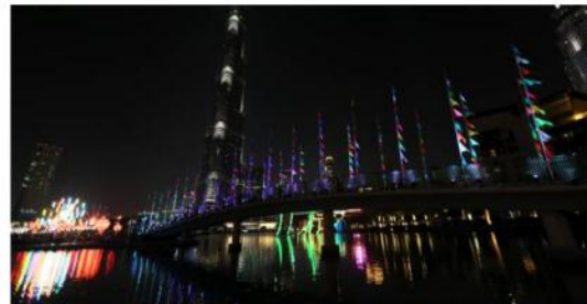
Dubaï illuminée le 24 mars, à l'image du 8 décembre lyonnais.

L'émirat s'offre une version sur mesure de l'événement emblématique de la cité des Gaules. Cocorico !