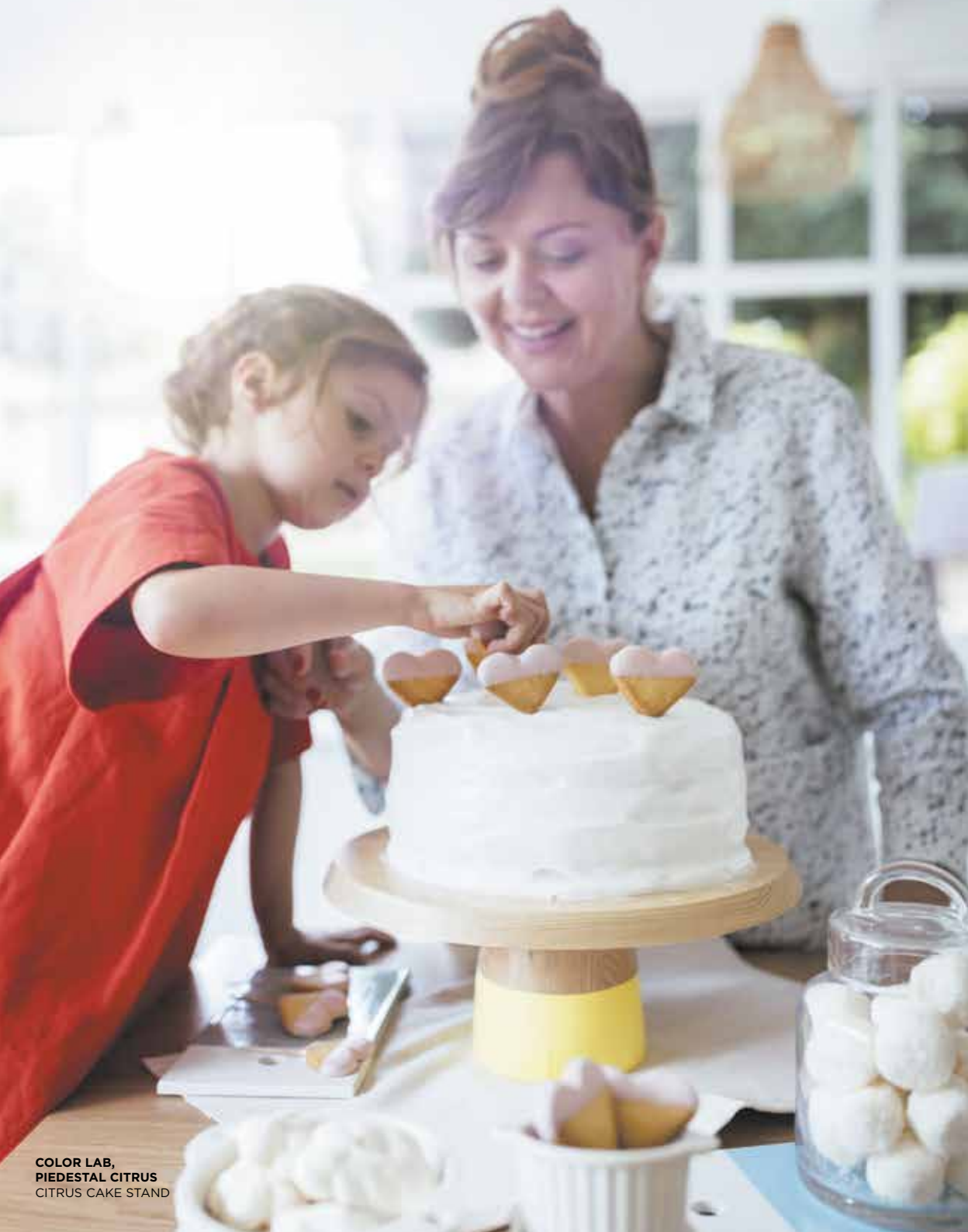
COLOR LAB, PIEDESTAL CITRUS CITRUS CAKE STAND