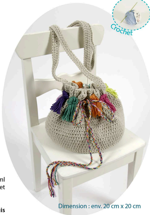
Dimension : env. 20 cm x 20 cm

Finir par une maille coulée, couper le fil et le rentrer.