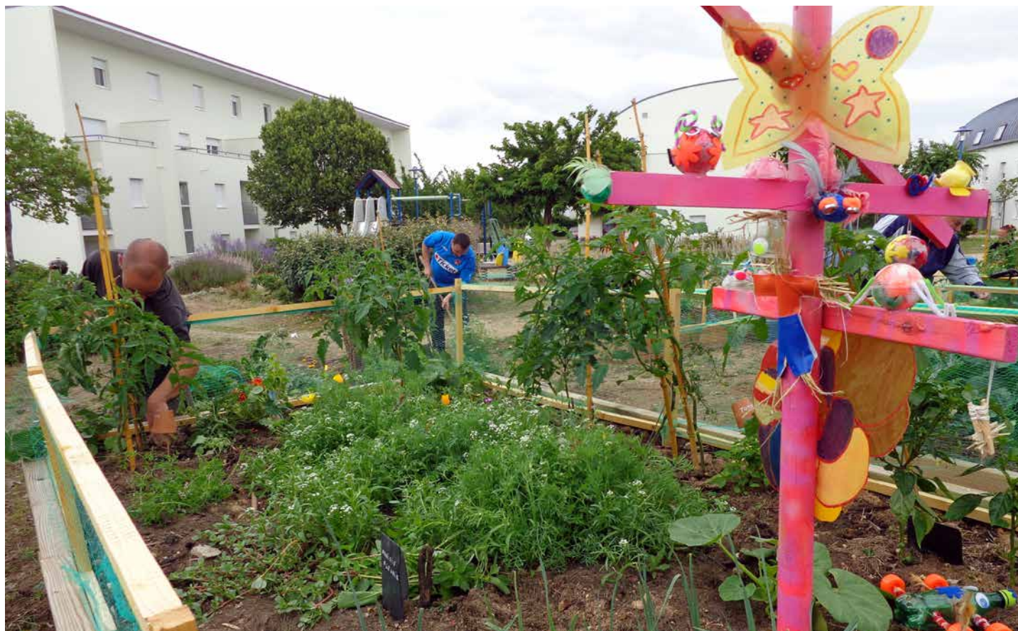
Ambiance colorée au Coteau.