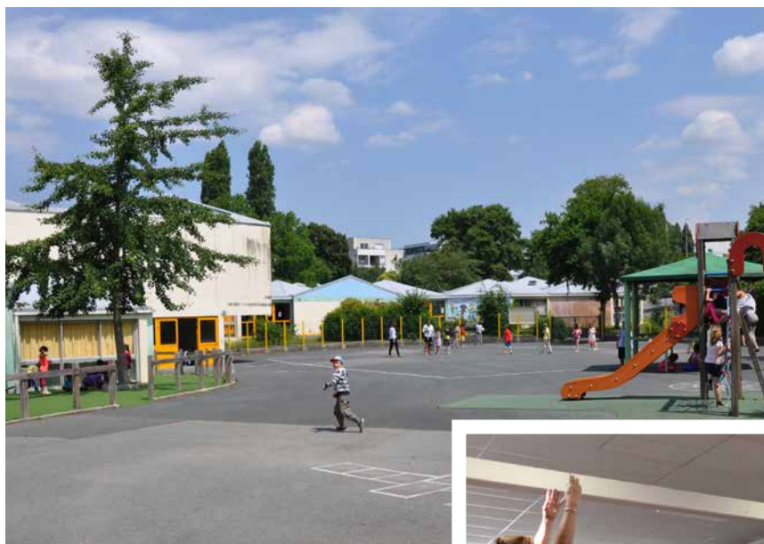
Une nouvelle école Pont Boileau sera construite.