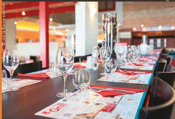
Le restaurant grill du Clair Bocage : restaurateur de gourmandises

Entrées et desserts sous forme de tapas, faites votre choix parmi nos gourmandises.