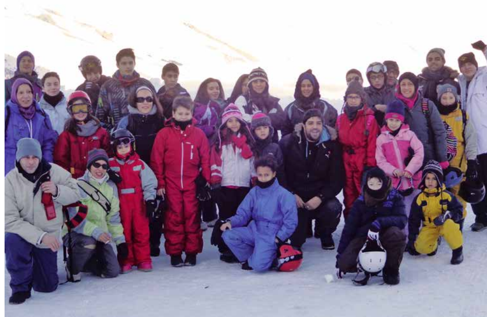
Sorties, raquettes, luges et veillées ont rythmé ce séjour, le premier du genre qui a regroupé jeunes et familles dans un cadre convivial et de partage.