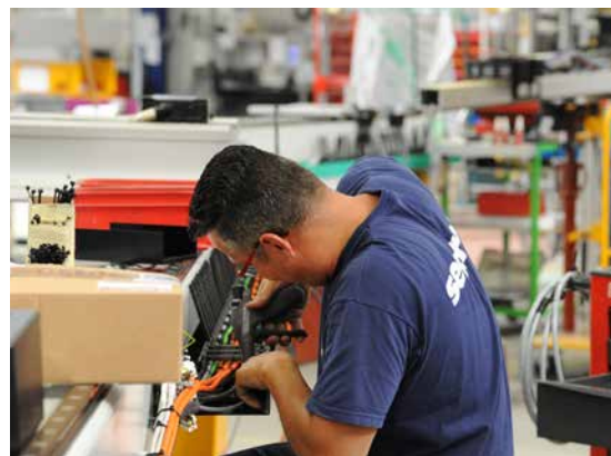
L'entreprise yonnaise Sepro robotique.