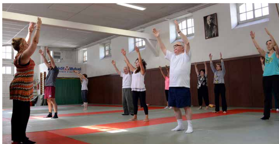
Activités pour les seniors.

“ Améliorer la qualité de vie et soutenir l'activité économique ”