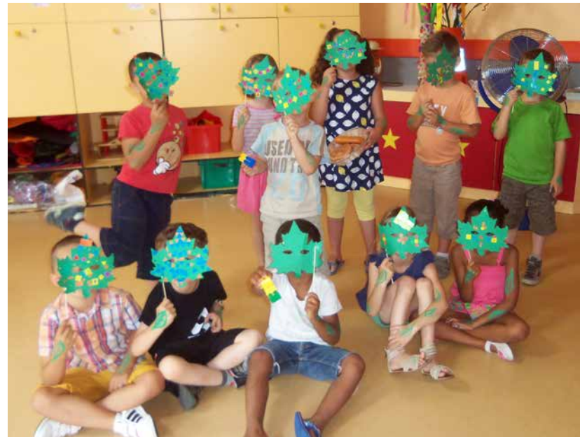
Les 5-6 ans du centre de loisirs de la Liberté déguisés en Hommes feuilles, inspirés du film « Epic ».

Pratique : Plaquette disponible à la maison de quartier de la Liberté et inscriptions auprès des accueils de loisirs.