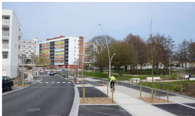
Le boulevard Branly réaménagé.