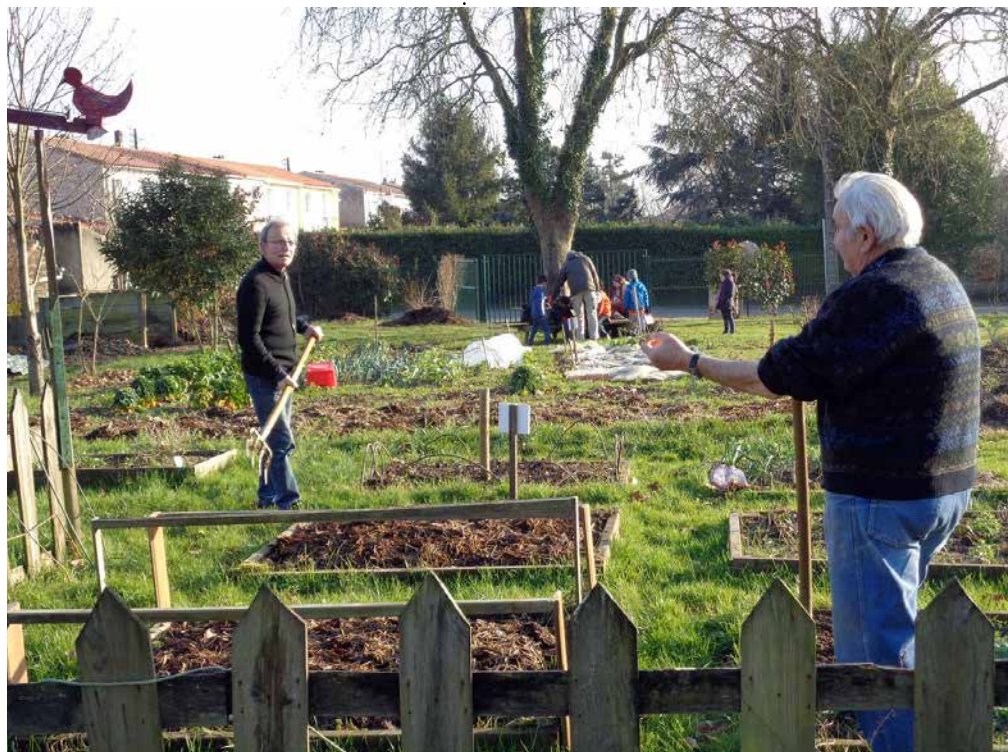
Les jardiniers à pied d'œuvre au Terrain d'aventures.

« Je faisais ma balade habituelle place Willy-Brandt et j'ai découvert un potager dans lequel des tomates commençaient à rougir. J'ai vu un panneau "Servez-vous !". Puis, deux dames se sont avancées et m'ont demandé ce que je faisais. C'est grâce à ce contact que j'ai découvert le groupe de jardiniers du Coteau. Cela me rappelle les expériences passées avec mon papa lorsque j'étais enfant. Mentalement, cela me fait du bien de toucher la terre, les légumes, de parler avec les autres, de partager mon savoir... Je me suis sentie tout de suite adoptée et moins seule. »