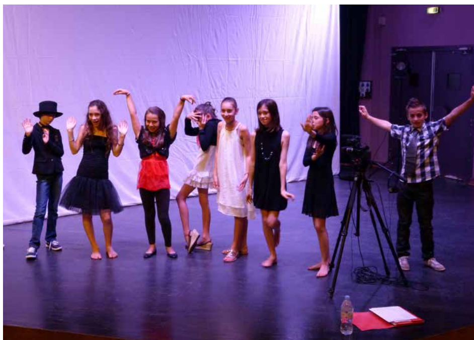
Silence, on joue !

Contact : direction de la Culture, au 02 51 47 48 20