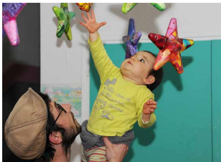
Une semaine pour les enfants et leurs parents.

à destination des enfants de 0 à 12 ans accompagnés de leurs parents. « Cette semaine offre différents