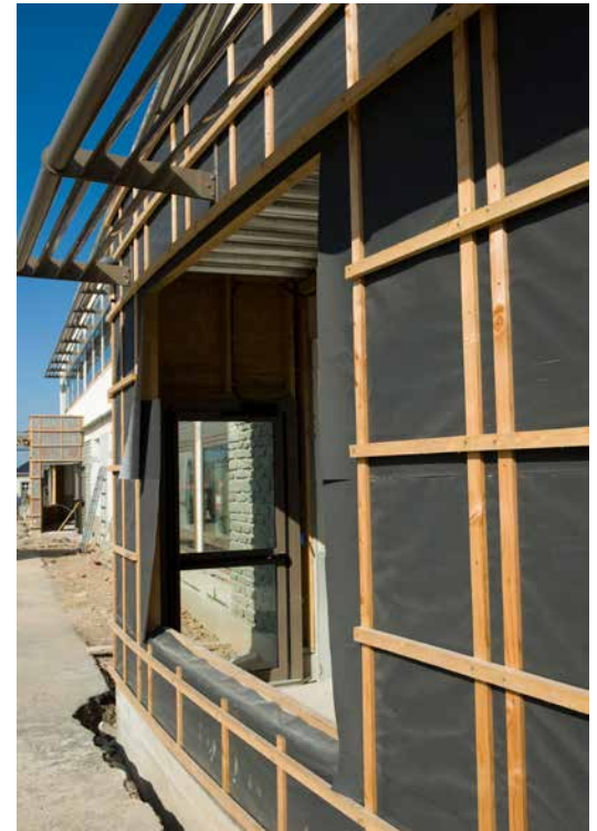
Travaux d'isolation extérieure sur un bâtiment.

Si l'ensemble des travaux est réalisé, les collectivités vendéennes peuvent réduire de l'ordre de 25 %