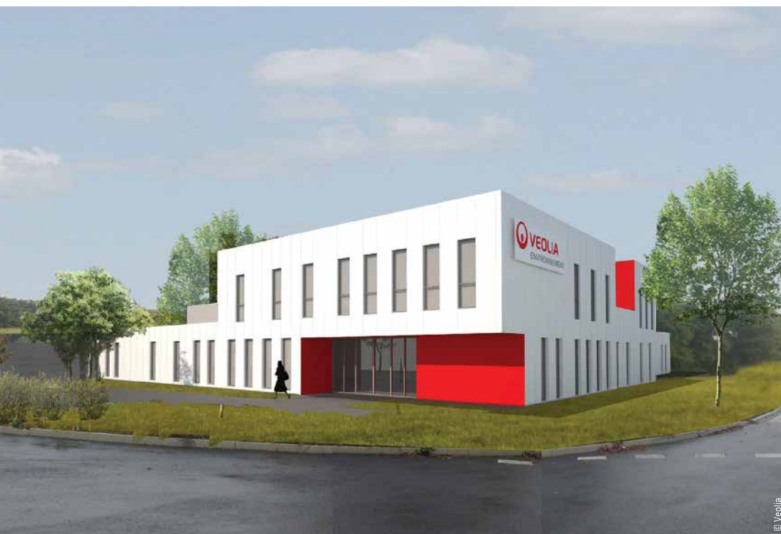
Le futur site de Veolia sur ParcÉco 85.

Veolia activité eau implante son siège départemental sur ParcÉco 85. Le bâtiment, en cours de construction, accueillera à terme une cinquantaine d'emplois. Sa livraison est prévue en avril 2016.