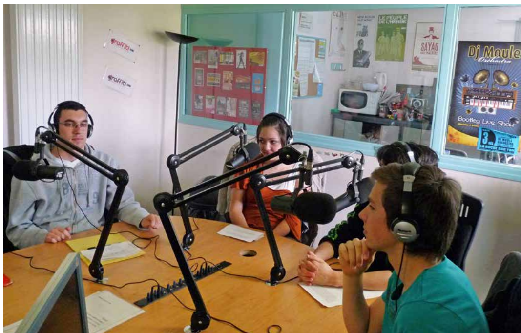
Graffiti Urban Radio.

Entre chorégraphie afro-hip-hop, enregistrements sonores et montage audio, tu mettras en sons et en jambes l'histoire australienne Didgeridoo.