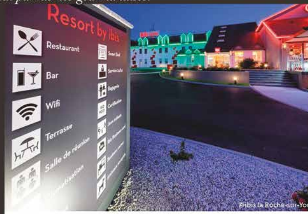
L'hôtel et ses services

Réservation au 02 51 37 82 82 • 160 route du Clair bocage • Mouilleron le Captif