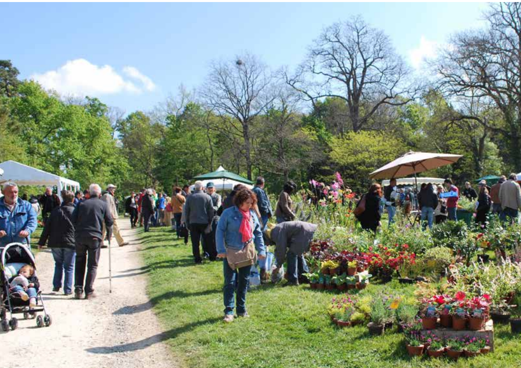
Partez à la recherche de vos futures plantes dans le parc du château des Oudairies.

L'association L'Asphodèle, en collaboration avec la Ville de La Roche-sur-Yon, organise la 14 e édition de sa traditionnelle fête des plantes le samedi 18 avril, de 10 h à 18 h, dans le parc du château des Oudairies. Une soixantaine d'exposants seront présents pour l'occasion ainsi que la Ligue pour la protection des oiseaux, le Relais pleine nature et environnement, l'association Entrelacs et Compost citoyen.