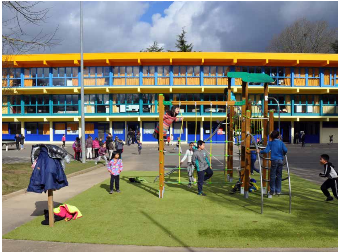
L'école élémentaire Jean-Yole.

Dans le cadre de la refonte nationale de la carte de l'éducation prioritaire, dix écoles de La Roche-sur-Yon pourraient sortir du Réseau réussite scolaire (RRS) dès la rentrée prochaine. Sont concernés : les groupes scolaires Jean-Yole, Pont Boileau, Jean-Moulin, Laennec et Pyramides, soit 1 200 élèves.