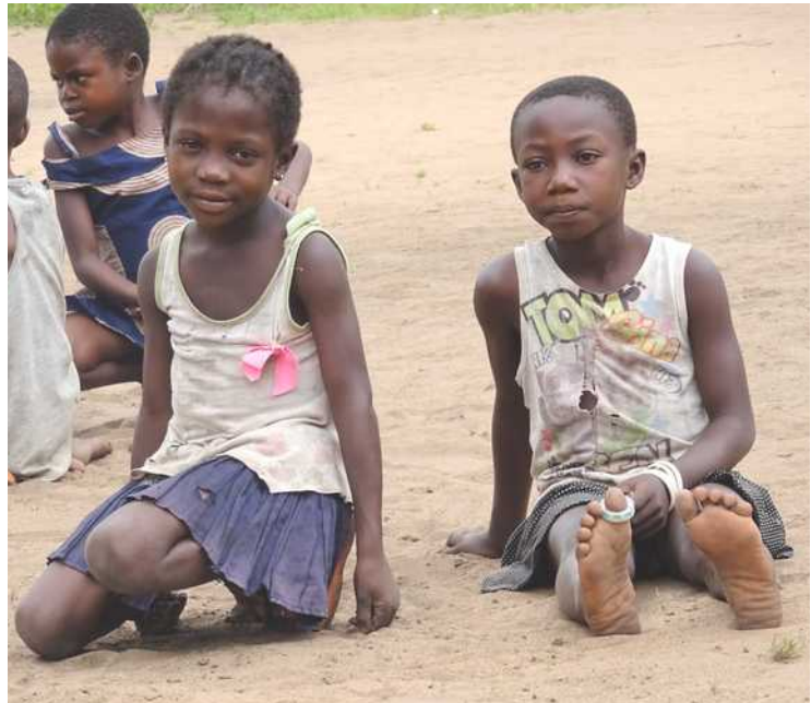
Bâtir un avenir pour les jeunes, avec eux

Nul ne peut le nier : préparer l'avenir d'une région demande à soigner la formation des plus jeunes. Or cette formation est en déliquescence sur le territoire de Bumba comme en beaucoup d'endroits de la RD Congo. L'éducation est souvent laissée à l'initiative du secteur privé. Les écoles payantes fleurissent aux quatre coins du pays dont l'ambition est souvent réduite à l'enrichissement de leurs promoteurs. Pas d'équipement pédagogique. Pas d'enseignant qualifié. Quel est l'avenir d'un jeune dont le diplôme certifie des compétences qu'il n'aurait pas acquises ?