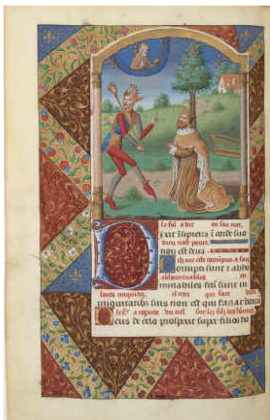
21. Psautier de Charles VIII , MSS, Latin 774, Paris