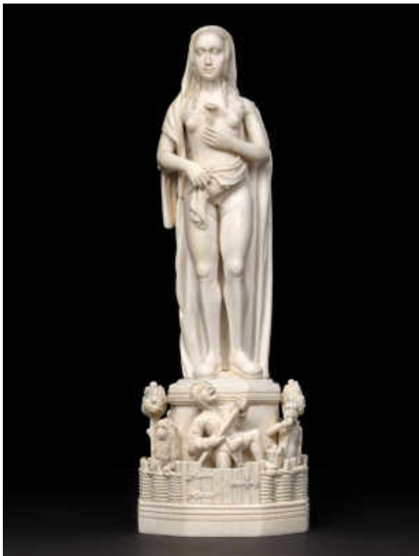
9. Vanité : femme et squelette . France (Paris), vers 1520. Ivoire, H. 28 cm ; l. 9,1 cm ; P. 7,9 cm. Berlin, Staatliche Museen zu Berlin, Skulpturensammlung und Museum für Byzantinische Kunst, inv. 8554