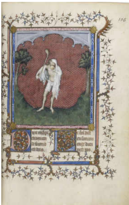
2. Jacquemart de Hesdin, Psautier de Jean de France, duc de Berry : illustration du psaume 52, l'insensé , détail. Paris ou Bourges, vers 1386. Enluminure sur parchemin. H. 250 mm ; l. 190 mm ; Ép. 80 mm (manuscrit fermé). Paris, Bibliothèque nationale de France, département des Manuscrits, Français 13091, fol. 106