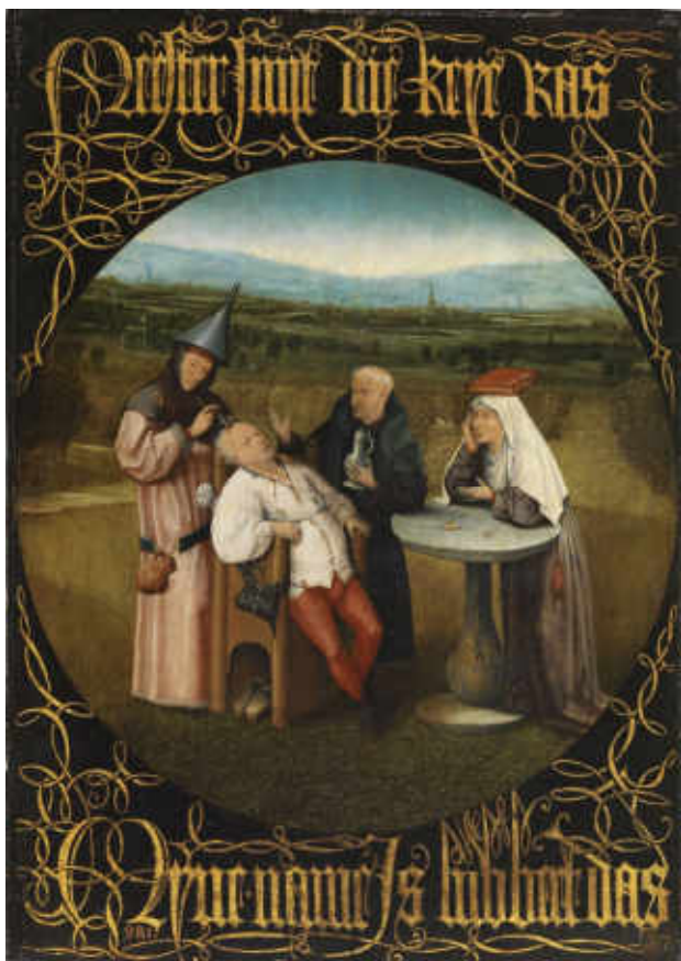
30. Hieronymus Bosch, Excision de la pierre de folie. Bois-le-Duc, vers 1501-1505. Huile sur bois (chêne), H. 48,5 cm ; l. 34,5 cm. Madrid, Museo Nacional del Prado, inv. P002056