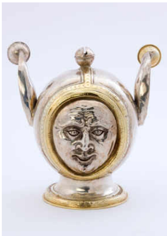
15. Gallus Mader, Gobelet en forme de tête de fou . Überlingen, vers 1570. Argent, partiellement doré, H. 14,3 cm ; L. 14,8 cm ; P. 11,5 cm env. ; Pds 290,62 g. Berne, Bernisches Historisches Museum (Depositum Gesellschaft zum Distelzwang, Bern), inv. H/2630