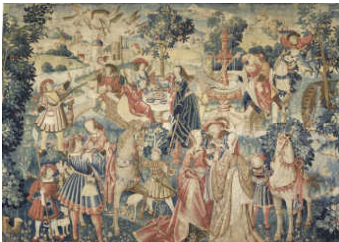
7. La Collation . Tournai (?), vers 1520. Tapisserie, laine et soie, H. 325 cm ; l. 458 cm. Paris, musée de Cluny – musée national du Moyen Âge, inv. Cl. 22855