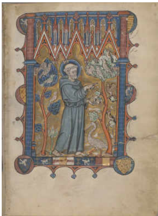
3. Psautier-livre d'heures : Noémi et Élimélek partant de Bethléem avec leurs enfants ; saint François prêchant aux oiseaux , détail. Amiens, fin du XIII e siècle. Enluminure sur parchemin, H. 182 mm ; l. 134 mm. New York, The Morgan Library & Museum, Purchased in 1927, MS M.729, fol. 2