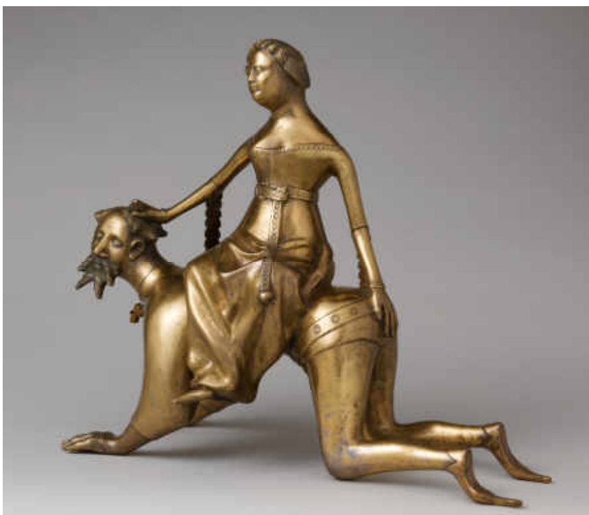
Aquamanile représentant Aristote et Phyllis, New York