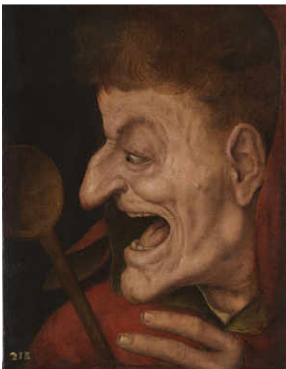
23. Quentin Metsys et atelier, Fou avec une cuillère. Anvers, vers 1525-1530. Huile sur papier monté sur panneau, H. 253 mm ; l. 194 mm. Anvers, The Phoebus Foundation