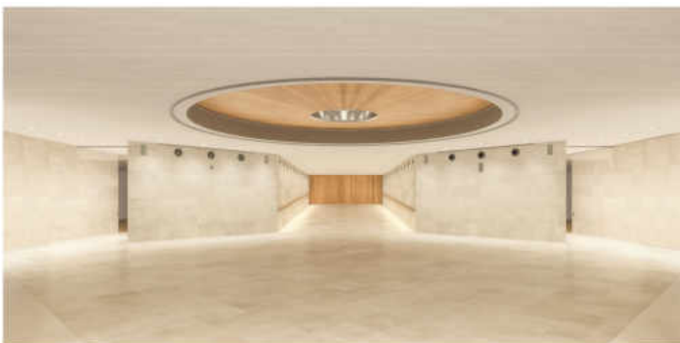
La nouvelle rampe d'accès et de la rotonde, revêtue à l'intérieur de lames en chêne blanchies et à l'extérieur, d'une coupole habillée en surface par une tôle inox réfléchissante de teinte mordorée, percée en son centre d'un oculus. Image du projet

Une nouvelle phase de travaux est prévue entre la fin de l'exposition "Figures du fou" et le début de l'expositions "Mamlouks", afin d'améliorer l'accueil de l'espace et le comptoir de la librairie-boutique avec une reprise architecturale et d'éclairage (maîtrise d'œuvre Fabien Gantois).