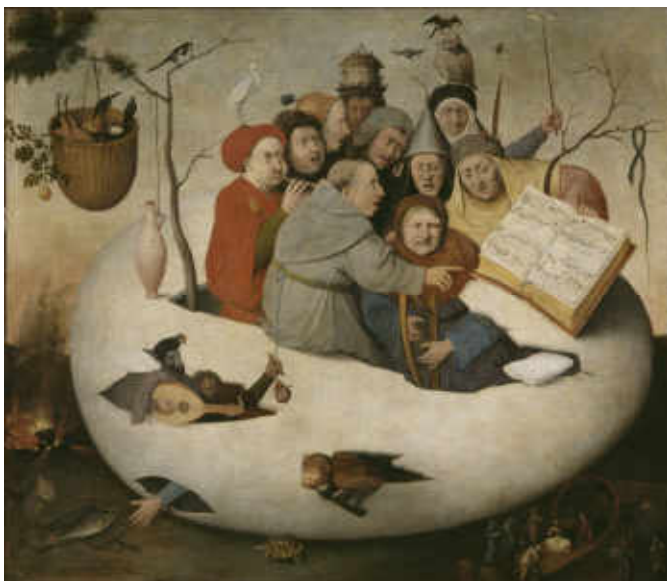
28. D'après Hyeronimus Bosch, Concert dans un œuf . Anciens Pays-Bas, milieu du XVI e siècle. Huile sur toile, H. 108,5 cm ; l. 126,5 cm. Lille, Palais des Beaux-Arts, inv. P.8