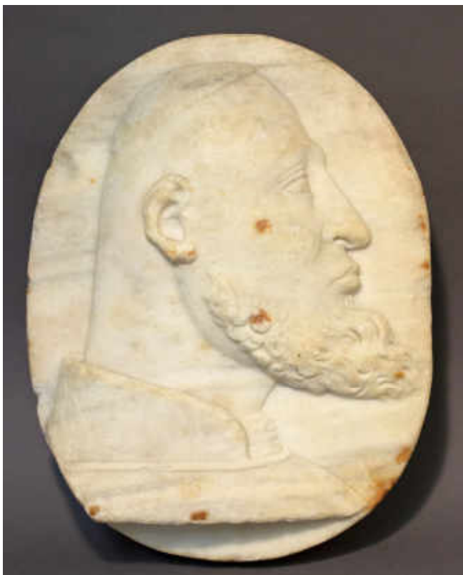
Francesco Laurana, Triboulet, bouffon de René d'Anjou

Personnage réel, devenu en quelque sorte « institutionnel », le fou a sa place à la cour, parmi les divertissements et les jeux aristocratiques. Il commente ou parodie les tournois et les joutes, il assiste aux bals. Sa présence semble introduire une distance ironique par rapport à ces manifestations de la sociabilité aristocratique. Ce fou subversif est tellement inscrit au cœur de la société de cour qu'il en devient un personnage de ses jeux : figure de pièces d'échec, il est aussi une figure de jeux de cartes, notamment des atouts du jeu de tarot, apparu au XV e siècle en Europe, et dont les premières cartes connues sont présentées ici. Sous cette forme, c'est l'ancêtre du joker de nos jeux de cartes.