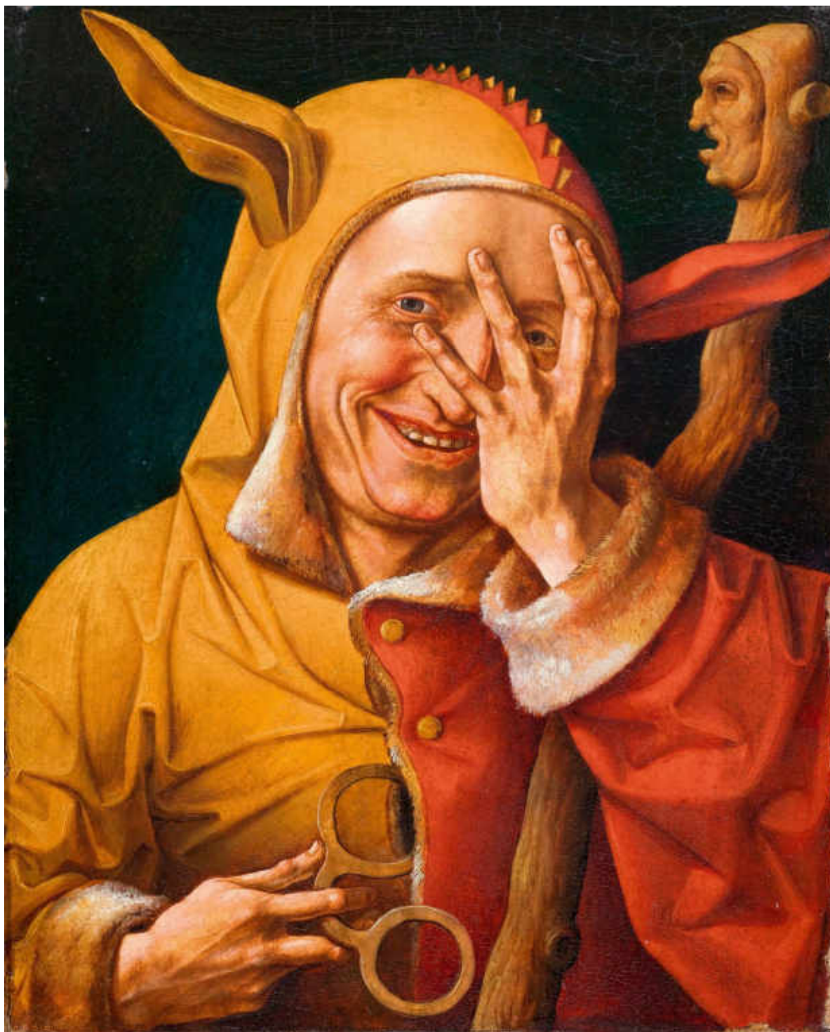
1. Maître de 1537, Portrait de fou regardant à travers ses doigts . Anciens Pays-Bas, vers 1548. Huile sur bois, H. 48,4 cm ; l. 39,6 cm. Anvers, The Phoebus Foundation

Merci de mentionner le crédit photographique et de nous envoyer une copie de l'article à l'adresse : celine.dauvergne@louvre.fr