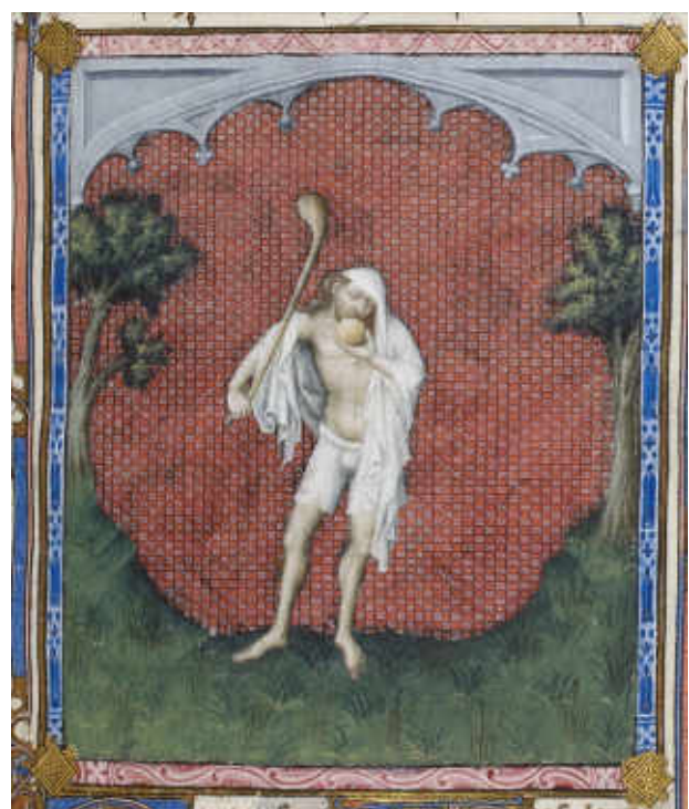
Jacquemart de Hesdin, Psautier du duc de Berry , détail

Dans un monde médiéval profondément religieux, la figure du fou est vue au départ comme l'incarnation de ceux qui refusent Dieu. Les artistes doivent représenter ce fou dans les enluminures qui ornent les psautiers, en particulier dans l'initiale « D » du psaume 52. Celui-ci commence par la phrase « Dixit insipiens in corde suo : non est Deus » (« L'insensé a dit en son cœur : il n'y a pas de Dieu »). L'initiale D qui ouvre ce psaume (et parfois une enluminure plus grande) montre donc très souvent la figure du fou qui refuse Dieu, avec des attributs de plus en plus codifiés : habits déchirés ou nudité complète, auxquels se substituent à la fin du Moyen Âge des vêtements bigarrés ; massue qui devient peu à peu une marotte ; pain ou fromage tenu dans la main. On peut rencontrer aussi des illustrations très complexes, comme l'histoire légendaire du roi Salomon et de son fou Marcolf, ou des traditions particulières, comme le chapeau à plumes du fou, employé surtout en Italie.