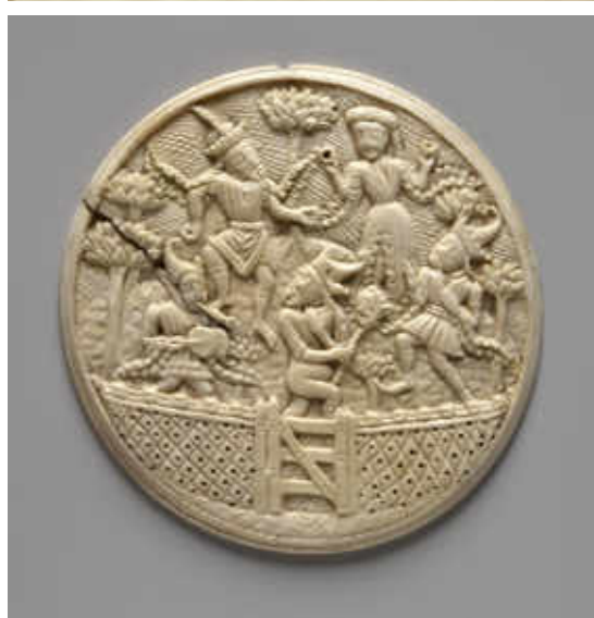
20. Valve de miroir : danseurs mauresques dans un jardin clos , Londres, 1856,0623.111