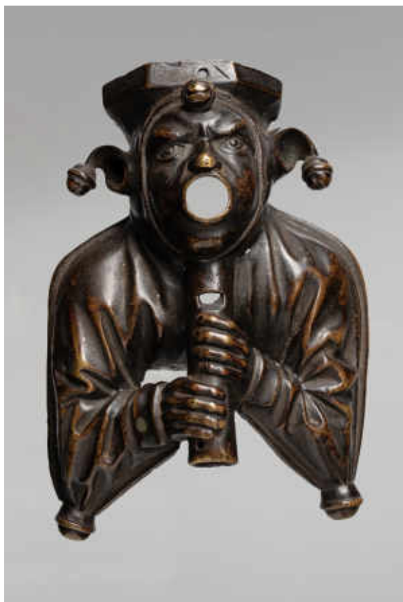
18. Bec de fontaine : bouffon. Anciens Pays-Bas (?), seconde moitié du XV e siècle. Bronze, H. 15,8 cm ; L. 10,8 cm ; P. 6,2 cm. Vienne, Kunsthistorisches Museum Vienna, Kunstkammer, inv. KK 12