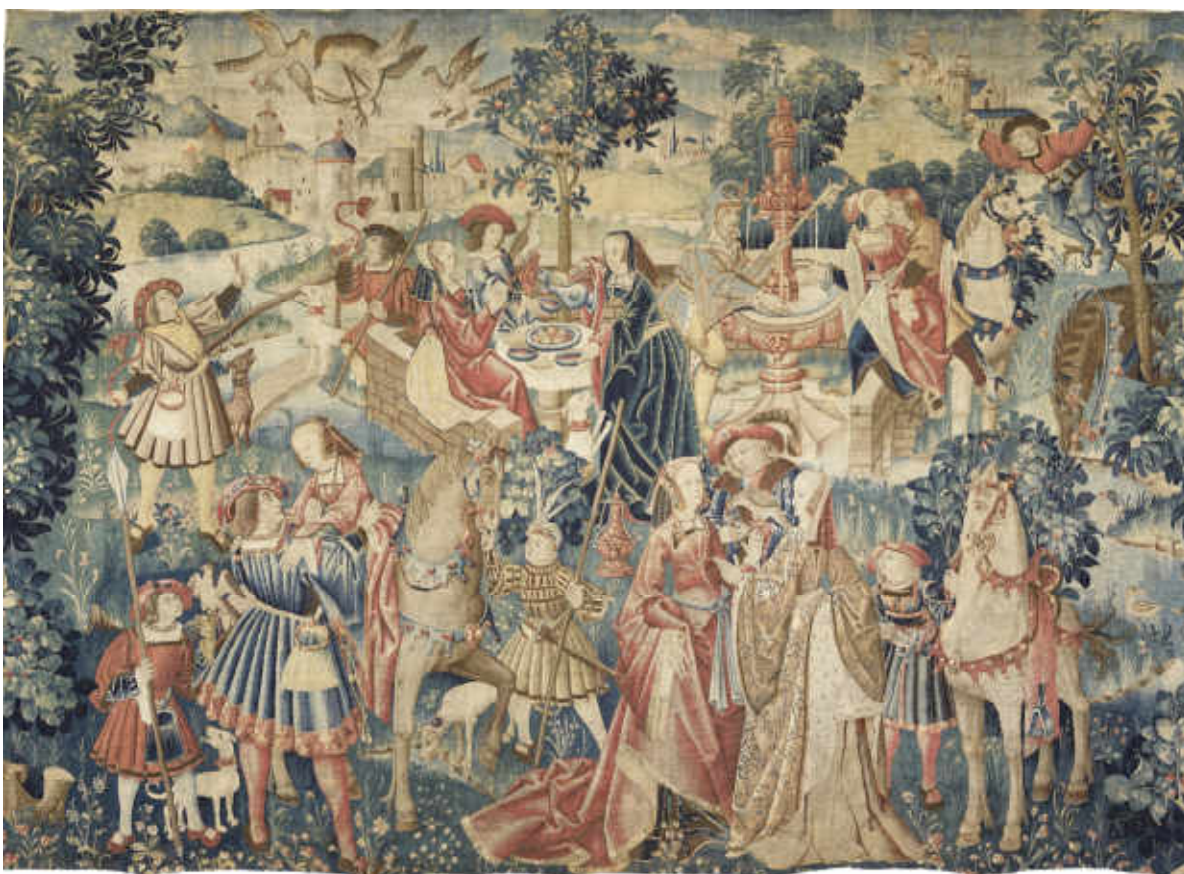
Tapisserie : scène de chasse, collation

Mais ce fou moraliste est pris à son propre jeu : les danses macabres, ces peintures fréquentes à la fin du Moyen Âge dans les cimetières ou les églises, intègrent le fou dans leur figuration de toute la société. C'est la Mort qui mène la danse et entraîne à sa suite pape et empereur, cardinal et roi, jusqu'au fou et au colporteur, cette humble représentation de l'âme humaine dans son vagabondage terrestre.