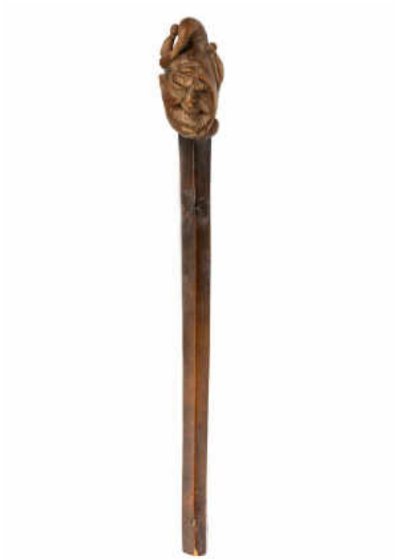
17. Marotte. France ou anciens Pays-Bas (?), seconde moitié du XVI e siècle. Buis, H. 43,5 cm ; L. 6 cm. Florence, Museo Nazionale del Bargello, inv. 1364C