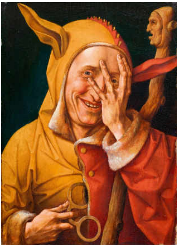
Maître de 1537, Portrait de fou regardant à travers ses doigts , Anvers

Depuis l'expansion formidable de la figure du fou à partir du XIV e siècle, la représentation de ce dernier s'est codifiée. Ce personnage est devenu bien reconnaissable grâce à son costume bigarré (expression du désordre) et à ses attributs : la marotte – parodie de sceptre avec laquelle le fou dialogue – les grelots de son costume et le bonnet à oreilles d'âne et crête de coq. Bruyant, exubérant, le fou est souvent musicien dans les fêtes : il joue de la musette ou cornemuse, d'autres instruments à vent ou des castagnettes. Il se fait aussi acrobate ou danseur. A la cour, sa folie est contagieuse et s'exprime dans la danse de la mauresque, où les danseurs – dont le fou – se transforment en contorsionnistes pour obtenir le prix dispensé par la dame.