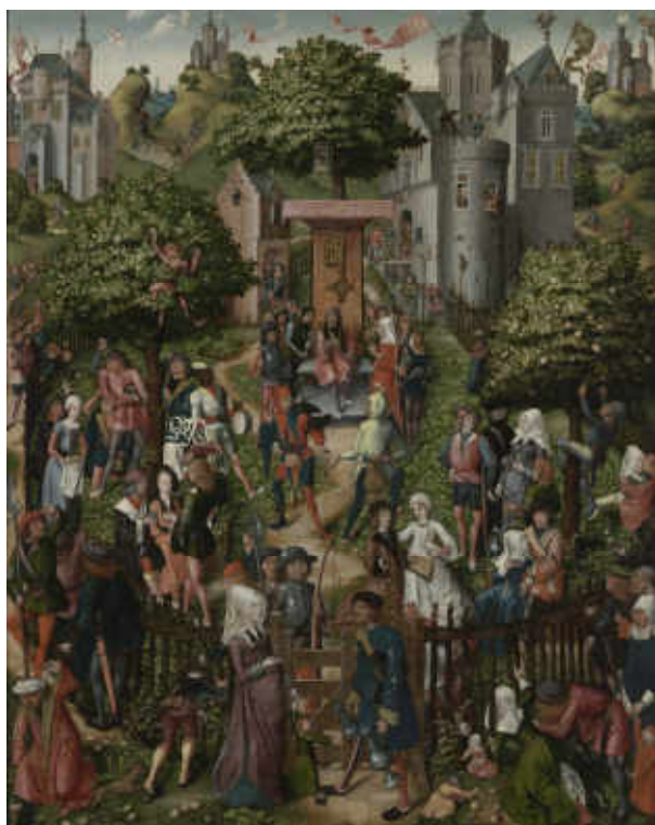
16. Maître de Francfort, La Fête des archers d'Anvers . Anvers, 1493. Huile sur bois, H. 176 cm ; l. 141 cm. Anvers, musée royal des Beaux-Arts Anvers – Communauté Flamande, inv. 529