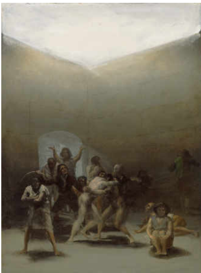
31. Francisco José de Goya y Lucientes, L'Enclos des fous , 1794. Huile sur étain, H. 43 cm ; l. 32 cm. Dallas (Texas), Meadows Museum, Southern Methodist University, Algur H. Meadows Collection, inv. MM. 67.01