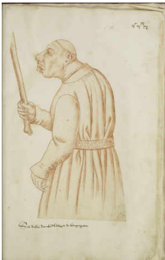
11. Jacques Le Boucq, Recueil d'Arras : Coquinet, sot du duc de Bourgogne. 1560. Dessin, sanguine sur pierre noire, H. 430 mm ; l. 310 mm. Arras, Pôle culturel Saint-Vaast/ Ronville/ Verlaine, Ms. 226, ouvert au fol. 288