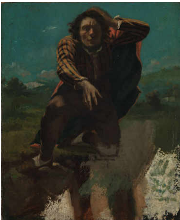
Gustave Courbet, L'Homme fou de peur, Oslo

Durant la période romantique, les artistes se servent souvent des grands auteurs du passé, comme Shakespeare, pour insuffler un vent de folie à leur peinture. Mais un auteur de leur époque joue un rôle tout aussi important, Victor Hugo. Celui-ci ressuscite la figure du fou : en 1831, dans Notre-Dame de Paris , avec le personnage de Quasimodo, élu « pape des fous » par la foule ; un an plus tard dans la pièce Le roi s'amuse , avec celui de Triboulet, bouffon à la cour de François I er et victime du destin. Ce dernier ouvrage connaît un succès mondial grâce à sa métamorphose en opéra par Verdi ( Rigoletto ). Fort de cet héritage, mais nourri également par l'étude croissante des maladies mentales, le visage du fou finit par s'identifier avec celui de l'artiste, aux prises avec ses angoisses, voire avec sa propre folie.