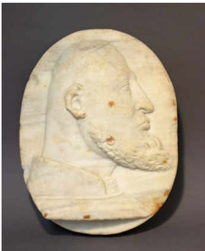
12. Francesco Laurana ou Pietro di Martino da Milano (?), Triboulet, bouffon de René d'Anjou . France (Barrois, Anjou ou Provence ?), vers 1461-1466. Marbre, H. 26,7 cm ; l. 20,6 cm ; P. 6,4 cm. Oberlin (Ohio), Allen Memorial Art Museum, Oberlin College, inv. 1954.23