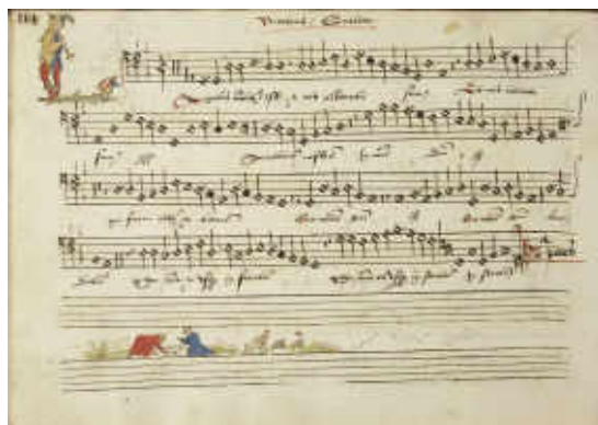
19. Chansonnier de Zeghere van Male. Bruges (?), 1542. Enluminure sur papier, livre relié , H. 220 mm ; l. 283 mm. Cambrai, Le Labo – Cambrai, bibliothèque classée de l'agglomération de Cambrai, ms. 127 A, fol. 114v