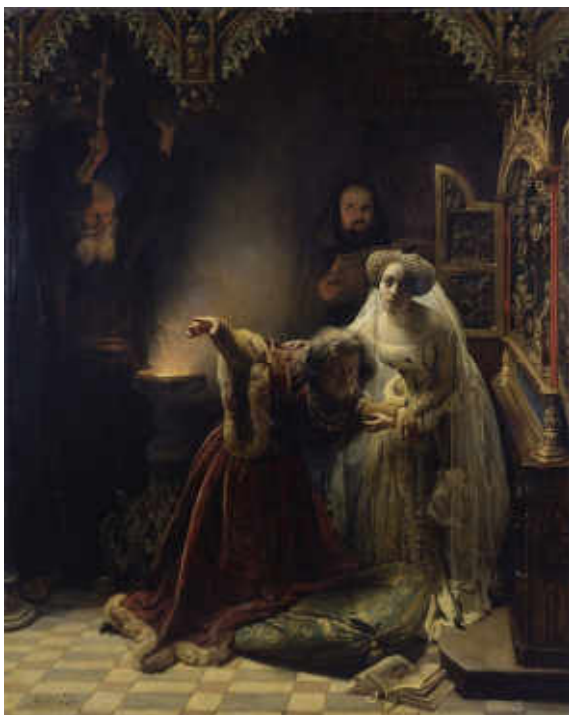
32. François-Auguste Biard, L'Exorcisme de la folie de Charles VI ou L'Exorcisme de Charles VI par deux moines augustins , 1839. Huile sur toile, H. 164 cm ; l. 131 cm. Leipzig, Museum der bildenden Künste Leipzig, inv. G 9