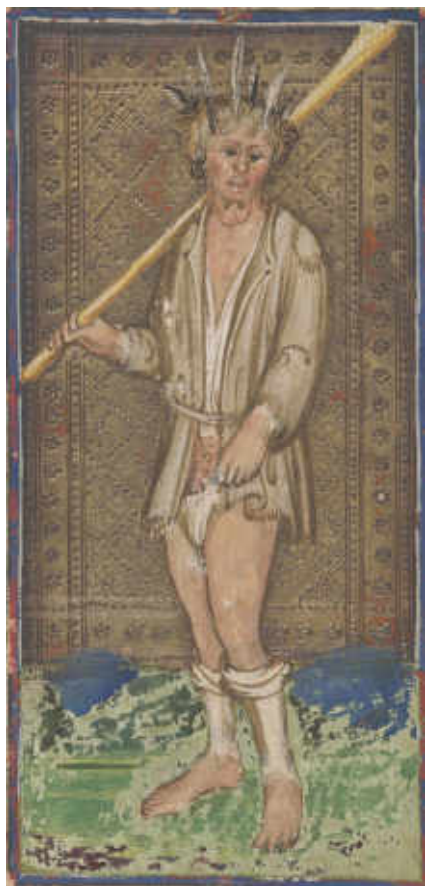
14. Bonifacio Bembo et atelier (attribué à), Tarot dit Visconti-Sforza ou Colleoni : le Fou. Crémone, vers 1456-1458. Encre noire sur assiette d'or et peinture à l'œuf, H. 175 mm ; l. 87 mm. New York, The Morgan Library & Museum, Purchased by J. Pierpont Morgan (1837-1913) in 1911, MS M.630 (n° 15)