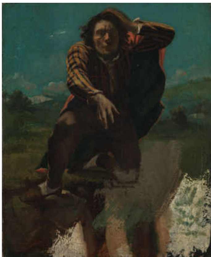
35. Gustave Courbet, Portrait de l'artiste dit Le Fou de peur, vers 1844-1848. Huile sur toile marouflée sur panneau, H. 60,5 cm ; l. 50 cm. Oslo, The National Museum, inv. NG.M.02169