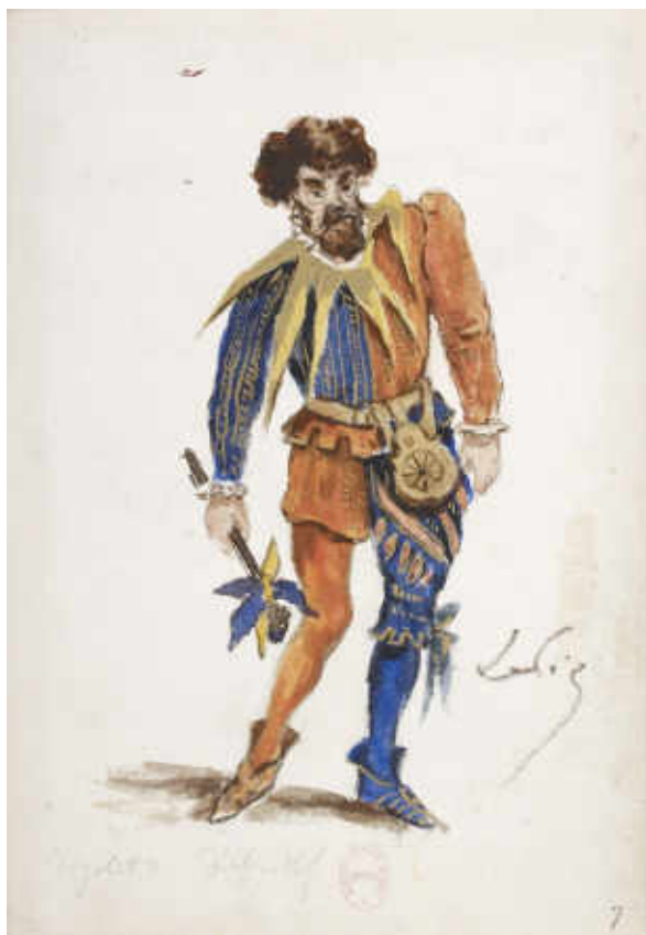
33. Ludovic Napoléon Lepic, Maquette de costume pour Rigoletto , 1885, aquarelle et gouache. Paris, Bnf, BMO, D216-38 (pl.7)