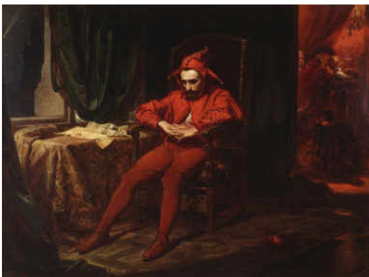
34. Jan Matejko, Stanczyk durant un bal après la perte de Smolensk . Cracovie, 1862. Huile sur toile, H. 88 cm ; l. 120 cm. Varsovie, National Museum in Warsaw, inv. MP 433 MNW