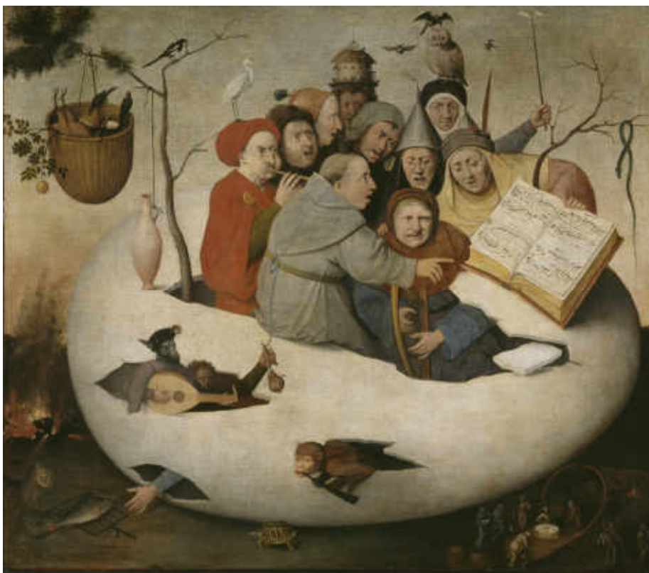
D'après Hieronymus Bosch, Le Concert dans l'œuf

La multiplication des fous donne lieu à différents mythes qui prétendent expliquer leur genèse, (notamment avec le thème de l'œuf), et leur expansion sur toute la terre, en particulier avec l'idée de la Nef des fous . Le tableau de Jérôme Bosch intitulé par la critique moderne La Nef des fous comme le livre de Brant, n'est en réalité que le fragment d'un triptyque démembré. Le message général du tableau renvoyait à l'univers de la folie, mais aussi à d'autres motifs : la peinture des vices, des fins dernières et l'incertitude du destin humain. Pieter Bruegel l'Ancien, comme Bosch, continue parfois d'user de la figure du fou de manière traditionnelle. Mais le plus souvent, il lui donne lui aussi une valeur nouvelle : le fou passe au second plan, il souligne, en tant que témoin, la folie des hommes.