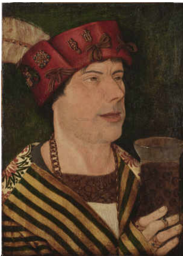
13. Artiste anonyme, Portrait d'un fou à la cour de Maximilien I er (?), vers 1515-1520. Huile sur bois, H. 30,6 cm ; l. 21,9 cm. Anvers, The Phoebus Foundation