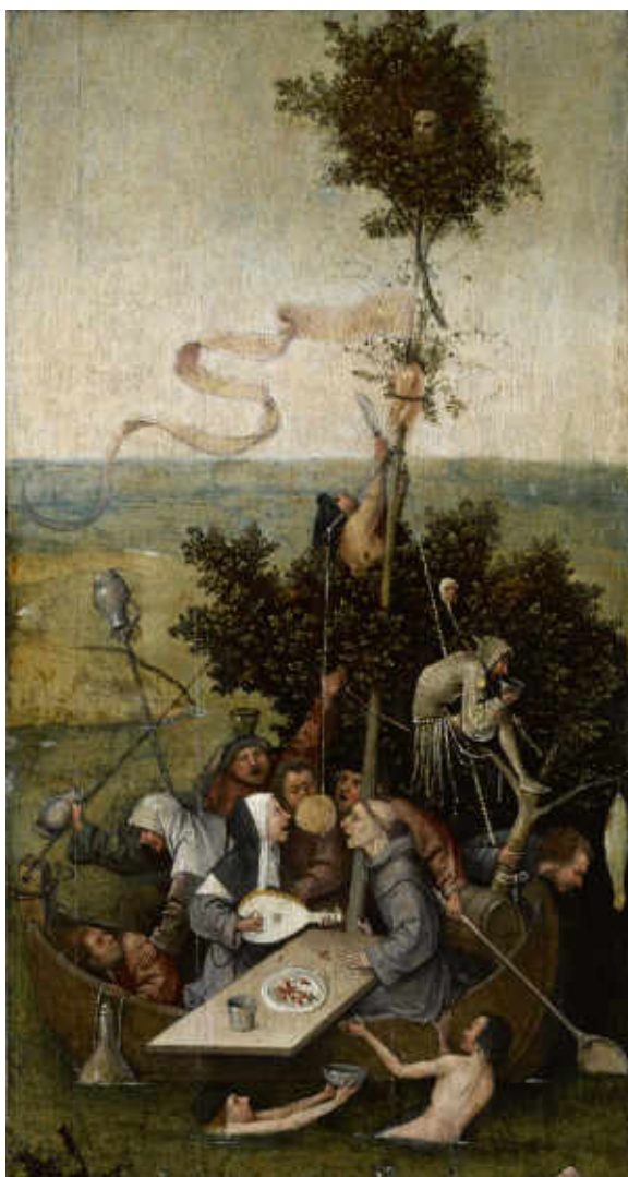
29. Hyeronimus Bosch, Satire des noceurs débauchés, dit La Nef des fous. Bois-le-Duc, vers 1505-1515. Huile sur bois (chêne), H. 58 cm ; l. 33 cm. Paris, musée du Louvre, département des Peintures, inv. RF 2218