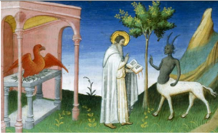
Jean de Mandeville Voyages autour de la terre Paris, 1410-1412 BNF, Manuscrits, français 2810, f. 151

Cet ouvrage est une description de la Terre, d'un monde « rond », une synthèse des savoirs antiques et de ceux qui sont parvenus en Occident, grâce aux expéditions en Asie, au XIII e siècle. C'est à la fois une géographie du monde réel et une géographie d'un monde de légendes, deux univers qui cohabitent, deux cartographies qui reflètent la nature humaine : d'un côté la raison cheminant vers le savoir et de l'autre la quête du merveilleux, du rêve, et le désir de donner corps à l'ineffable et à l'indicible.