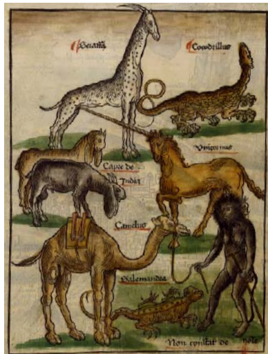
Bernhard de Breydenbach Pèlerinage en Terre sainte et au Saint-Sépulcre Mayence, 1486 BNF, Réserve, véliens 769

C'est un hybride puisqu'il est le résultat de l'union entre l'homme et le cheval. Il est athlétique et harmonieux. Il peut être à la fois le symbole de la barbarie et de la sagesse. Il sera repris dans l'imagerie astrologique, puisque le sagittaire est un centaure qui tire à l'arc. Son image est très répandue dans l'art persan. Il est présent dans les marges des manuscrits médiévaux. Il symbolise le paganisme ou l'homme sous l'emprise de ses pulsions animales.