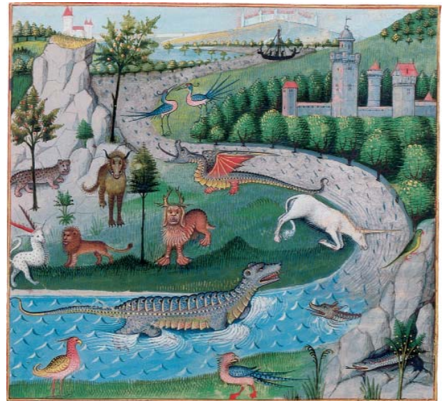
Secrets d'histoire naturelle Centre-ouest, vers 1480-1485 BNF, Manuscrits, français 22971, f. 15 v° Licorne et crocodile en Egypte. La licorne trempe sa corne dans la rivière pour la purifier.