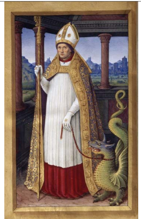
Grandes Heures d'Anne de Bretagne Tours, vers 1503-1508 BNF, Manuscrits, latin 9474, f. 185 v° Saint Lifard