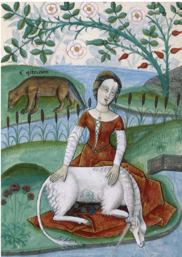
Livre des simples médecines

L'initiale A, au début du livre de Judith, est envahie de feuillages entrelacés, de lignes sinueuses élégantes, d'un étrange oiseau-dragon multicolore. Dans la marge, un combat entre l'aigle et le dragon, symbole de la lutte du Bien et du Mal. C'est l'aigle qui tient le dragon dans son bec, vainqueur certain du monstre hybride.