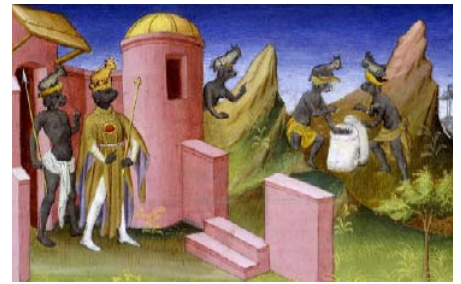
Odéric de Pordenone (1265-1331) Itinerarium (Livre des merveilles) Paris, 1410-1412 BNF, Manuscrits, français 2810, f. 106

Les récits de voyage voient aussi fleurir d'autres fables, comme celle d'une étoffe faite avec de la soie (ou de la laine) de salamandre, soie blanche, d'une grande souplesse et qui résiste à l'action d'un feu très ardent.